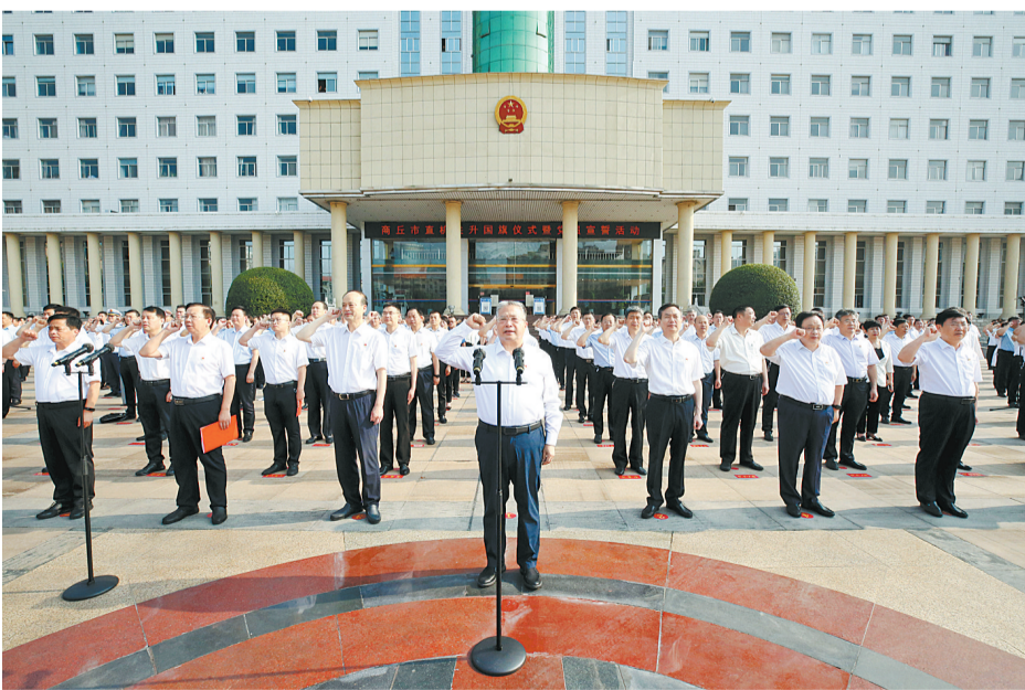
7月1日，市直机关升国旗仪式暨党员宣誓活动在市行政中心广场举行。

本报讯（记者 祁博）风展红旗如画，砥砺初心如磐。7月1日，在中国共产党成立101周年之际，市直机关升国旗仪式暨党员宣誓活动在市行政中心广场举行，激励全市广大党员干部大力弘扬伟大建党精神，坚定理想信念，践行初心使命，传承红色基因，不负人民期盼，以开拓者的饱满激情、奉献者的无私精神、奋进者的昂扬姿态，迎接党的二十大胜利召开。