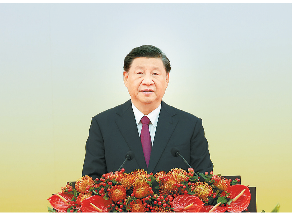
7月1日上午，庆祝香港回归祖国25周年大会暨香港特别行政区第六届政府就职典礼在香港会展中心隆重举行。中共中央总书记、国家主席、中央军委主席习近平出席并发表重要讲话。