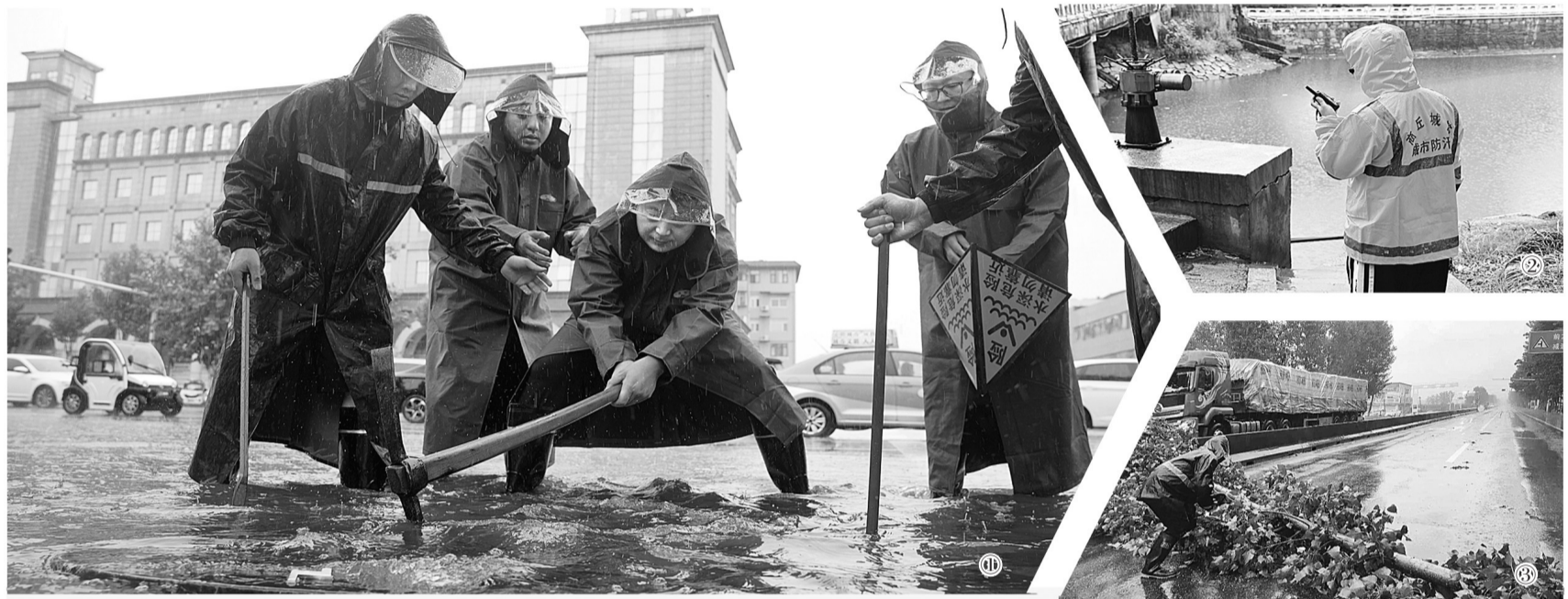
图① 7月5日，市城管系统突击队员打开雨水箐子，清除杂物，加速排水。

另外，救援队还组织60余名年富力强的、有丰富救援经验的队员组建了一个应急救援群，队员们随时保持战斗状态，手机24小时不关机，如果有水上救援和防汛救灾的行动，保证能够及时出动，随时可以发挥作用。