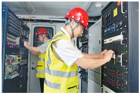
工程师在应急保障车内紧急操作保障信号畅通