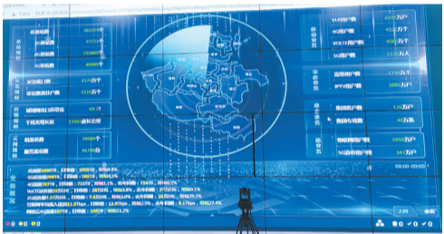
网络部智能防汛监测系统大屏

7月5日、6日,我市遭遇暴雨侵袭,多区域移动通信网络设施受损。为全面做好2022年防汛应急保障工作,高效保障汛期通信安全,河南移动商丘分公司应急通信领导小组组长、总经理虎威紧急召集应急通信领导小组,第一时间发出集结命令,迅速组织开展防汛应急保障工作,高效保障应急通信畅通无阻。