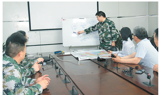
梁园分公司网络保障队部署应急工作