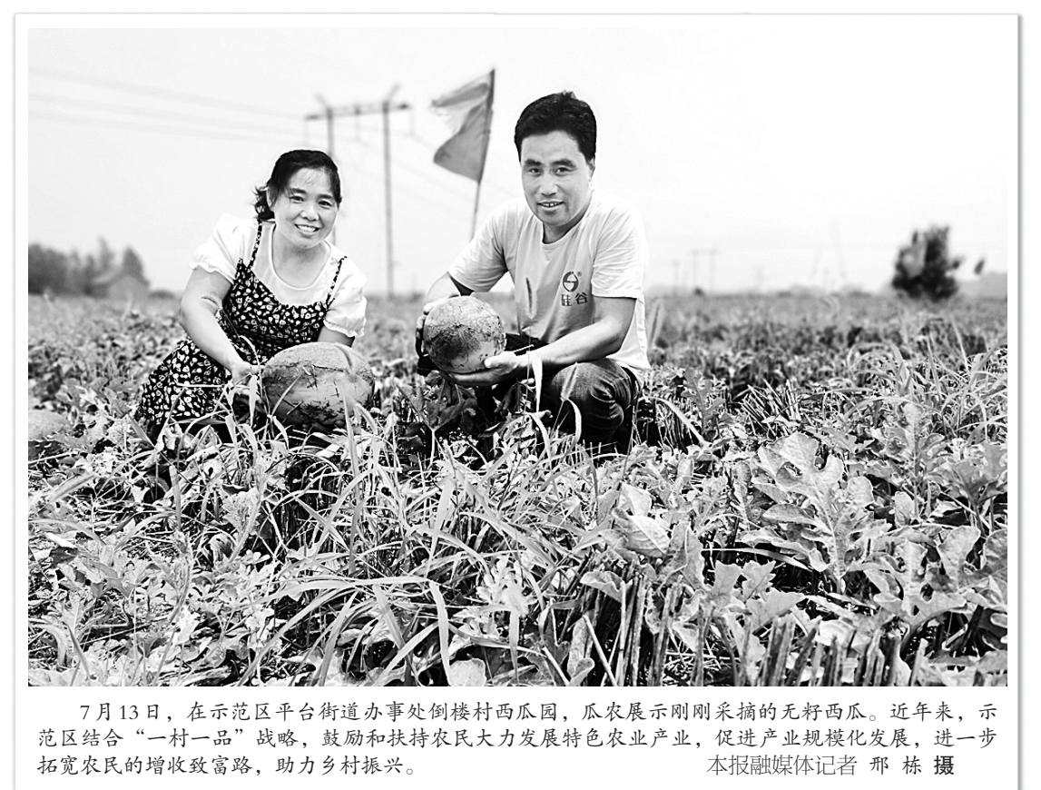
7月13日,在示范区平台街道办事处西楼村西瓜园,瓜农展示刚刚采摘的无籽西瓜。近年来,示范区结合“一村一品”战略,鼓励和扶持农民大力发展特色农业产业,促进产业规模化发展,进一步拓宽农民的增收致富路,助力乡村振兴。