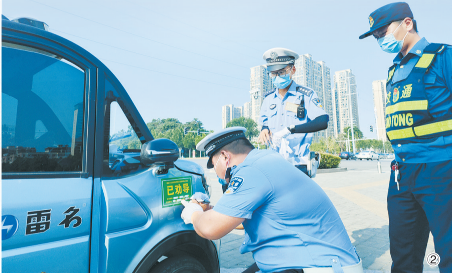
图②:在宋城路与神火大道交叉口,交警对违反禁行规定的电动四轮车贴上“已劝导”贴纸。