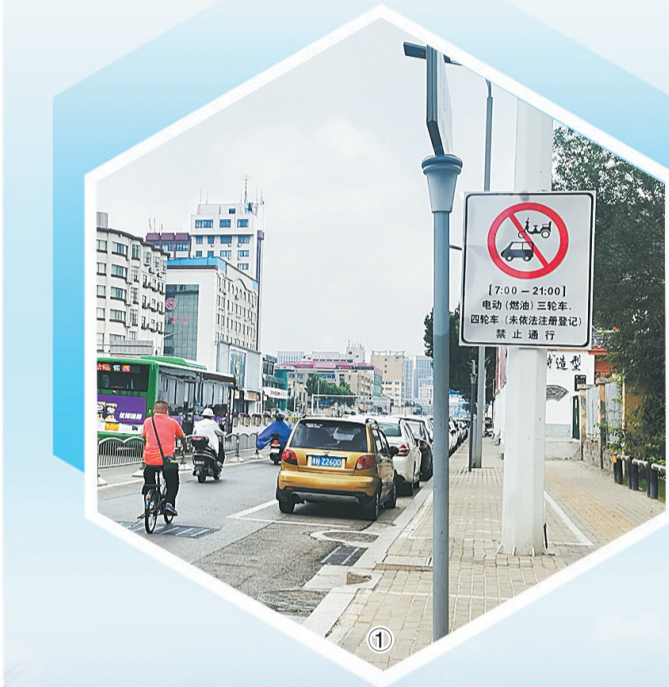
图①:归德路与文化路交叉口,交通秩序井然。

记者感言:治理电动三轮车、电动四轮车,是推进城市发展、提升美好生活的需要。对一座城市而言,文明交通对城市发展至关重要。本次治理是关乎商丘城市发展的大事,需要每一位市民的努力。广大市民一定要积极响应、支持、参与到治理中,为营造安全有序的交通环境,建设安全顺畅、整洁规范、文明有序、宜居宜业的商丘贡献自己的一份力量。