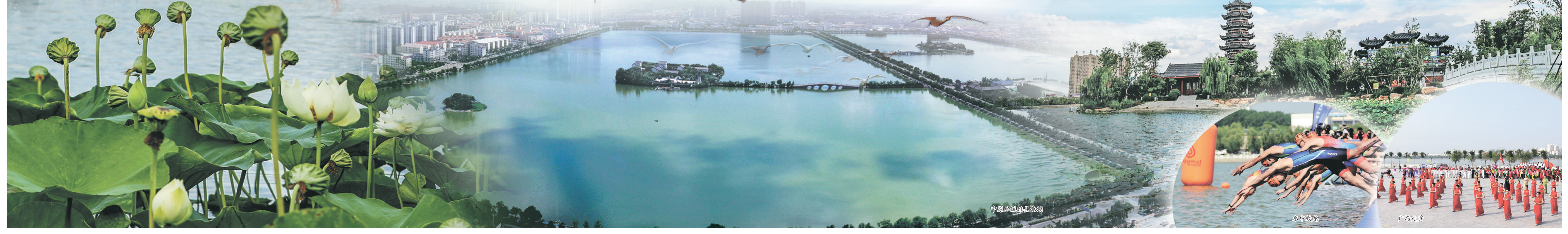
中原水城睢县航拍