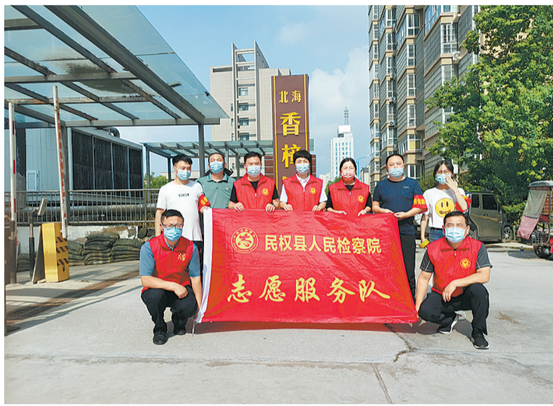
连日来,民权县人民检察院第一时间组建志愿者服务队助力疫情防控,协助社区开展核酸检测秩序维护、宣传引导、物质供给等工作,为打赢疫情防控阻击战贡献检察力量。

检察院互相支持,友谊深厚,本次“企业刑事合规研究中心”的成立书写了校检双方合作的新篇章,使双方的合作更具具体性与时代性,也为深化推动企业合规检察实践与理论研究深度融合提供了高层次、高水平的新平台。商丘市检察机关高度重视研究中心的发展建设,将与商丘师范学院开展更深入的法律理论研究和实务合作,实现实务和理论研究双轮驱动,推动商丘涉案企业合规改革工作依法有序运行,构建法律行业领域特色模式,努力营造商丘高质量法治化营商环境,为商丘师范学院企业刑事合规改革深入研究提供充分的支持与帮助。我们将以此校检合作为契机,有效促进检察实务与法学教育的良性互动,推动法学理论与实践共同创新发展。在法治人才培养、科学研究、社会服务等方面不断深化合作,以更大力度、更深层次、更实举措推动校检合作互利共赢,确保涉案企业合规改革工作取得实效,为我市经济社会高质量发展作出积极贡献,以优异成绩迎接党的二十大胜利召开。