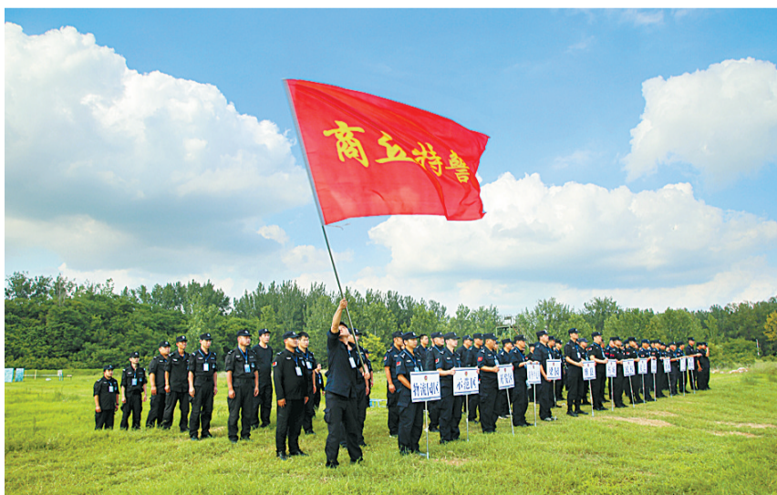
来之能战,战之能胜。