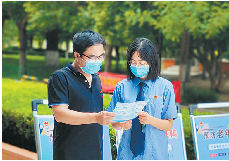
7月27日,夏邑县人民检察院组织干警开展防范养老诈骗宣传活动,向群众揭露提供“养老服务”、投资“养老项目”、销售“养老产品”、代办“养老保险”“低价旅游”等常见的诈骗方式,引导广大群众特别是老年人增强防范意识,时刻保持警惕,看好自己的“钱袋子”,守好自己的“血汗钱”。