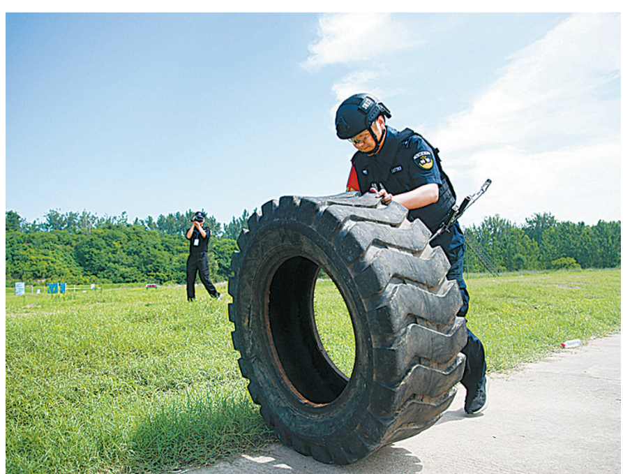
厉兵秣马,以练为战。

精度射击、双人长短枪战术射击、搬运弹药箱……近日,来自市公安局及其所属各个县局的200余名特警队员,进行了一场精彩的“真枪实弹”考核“大比武”。“大比武”围绕综合体能技