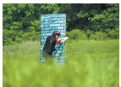
心无旁骛,弹无虚发。