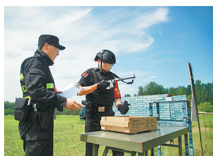
骄阳似火,磨练技能。

精度射击、双人长短枪战术射击、搬运弹药箱……近日,来自市公安局及其所属各个县局的200余名特警队员,进行了一场精彩的“真枪实弹”考核“大比武”。“大比武”围绕综合体能技