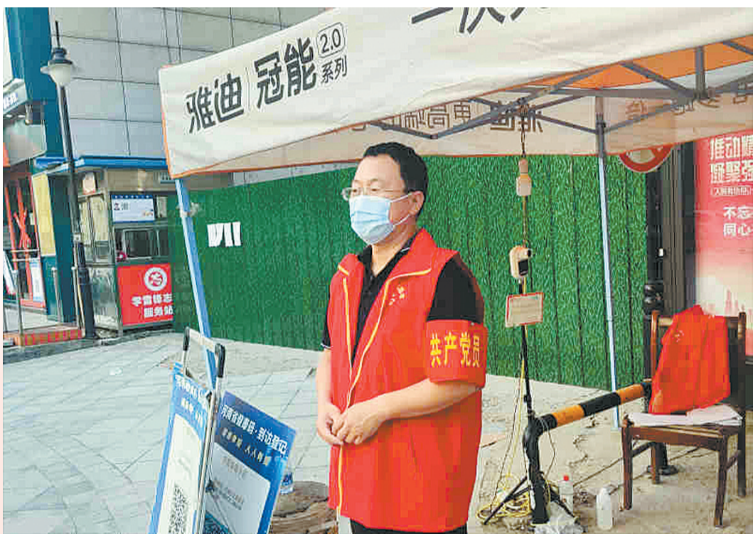
8月1日，民权县实验小学老师在疫情防控卡点值勤。在疫情防控的关键时期，民权县实验小学党员闻令而动，主动到各小区、社区报备，参与疫情防控工作。他们积极参与疫情防控点值守，宣传疫情防控知识，协助社区人员在防控点严格控制人员进出，当好核酸检测志愿者，参与秩序维护、测量体温工作。