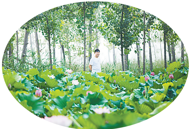
万亩荷塘花盛开。

豫鲁交界,黄河故道,绵延数十里,万亩荷塘美如画境。早些天,荷花盛开时,从湖面上放眼望去,层层叠叠的荷叶浑圆、碧绿,白莲花冰清玉洁,红莲花灿如锦,虽有烈日炎炎,也抵挡不住游客们赏花的热情,大家拍照记录美好生活,感受原生态的独特美景。