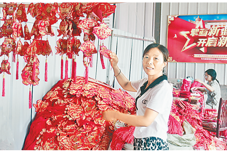
8月3日,夏邑县孔庄乡三陈楼村村民在村电商工艺品生产车间检查产品质量。该村从事电商工艺品生产销售的有100余人,成为乡村振兴一大主导产业。

全民阅读进军营活动,不仅是梁园区图书馆推动全民阅读的一个重要组成部分,也是文化拥军的重要内容。该馆持续多年开展“八一”拥军、图书进军营等活动,助推全民阅读活动开展。同时,丰富官兵们的精神文化生活,加强军地文化资源共享,促进军地文化融合发展。