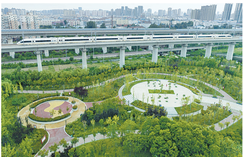
一列高铁从公园旁呼啸而过。