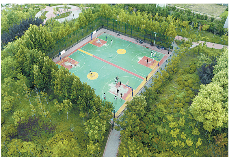
公园里的篮球场被绿树包围。