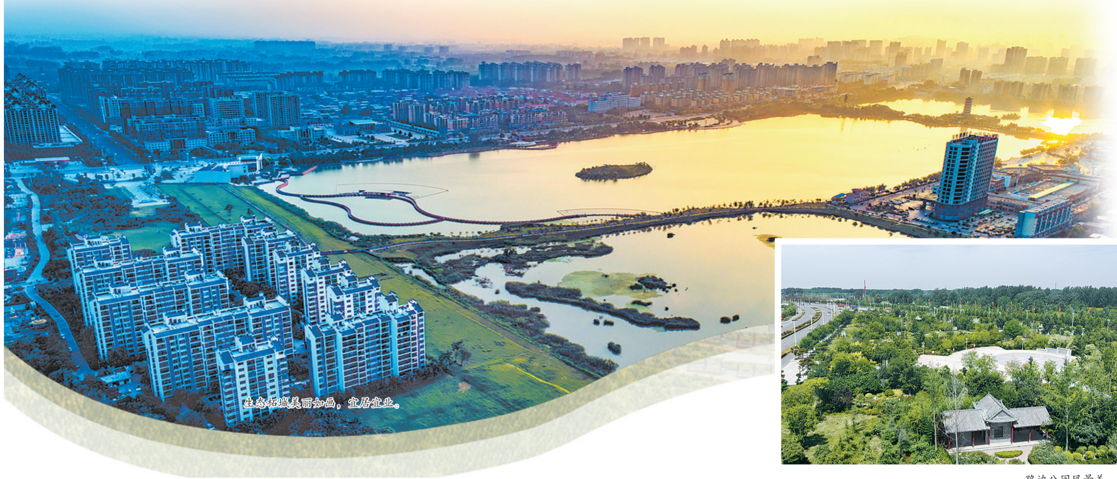
生态柘城美丽如画，宜居宜业。