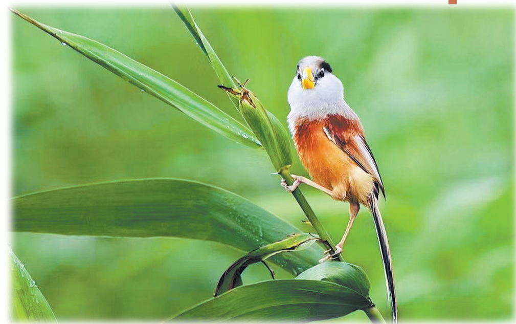
震旦鸦雀在容湖芦苇荡里安家。

执笔:本报融媒体记者 蔡明慧