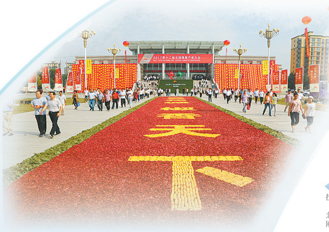
柘城已经连续举办5届全国辣椒产业大会。图为柘城县举办第12届辣椒产业大会的场景。