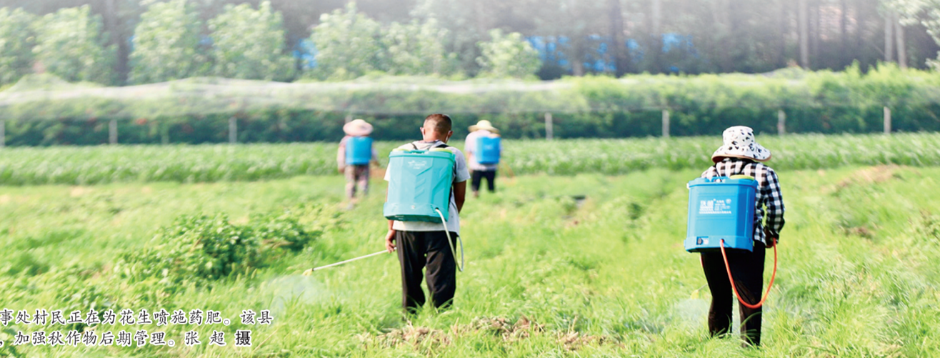
8月21日,柘城县浦东街道办事处村民正在为花生喷施追肥。该县一手抓疫情防控,一手抓农业生产,加强秋作物后期管理。