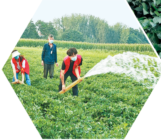
夏邑县农机服务中心组织开展大豆玉米带状复合种植机械化植保作业。