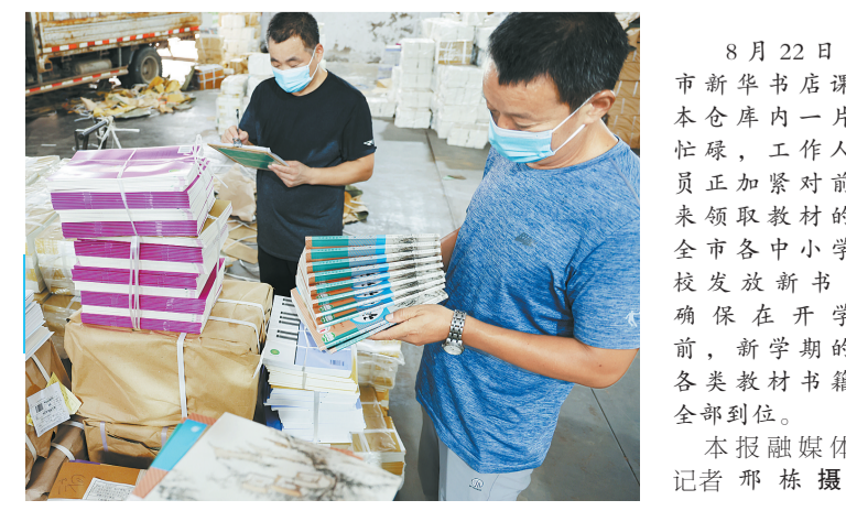
8月22日,市新华书店课本仓库内一片忙碌,工作人员正加紧对前来领取教材的全市各中小学校的教材,确保在开学前,新学期的各类教材书籍全部到位。

服务。针对认证对象年龄偏大、行动不便的居民,确保有人上门认证,做到不遗漏、不拖延;保障所设立服务窗口,对认证不成功的特殊人员采取人工认证;帮助那些不会使用APP认证的老年人下载认证系统,解决他们的后顾之忧。开展业务培训,完善奖惩制度。对辖区内7个社区17个工作站的业务经办人员进行业务培训,规范经办流程,每天通报认证进度,对排名前三的社区进行表扬,对落后社区进行督促,确保2022年度养老保险认证工作有序推进;对经核查已死亡或已享受其他社会保险待遇人员及时办理终止手续,对冒领养老金的进行追缴。