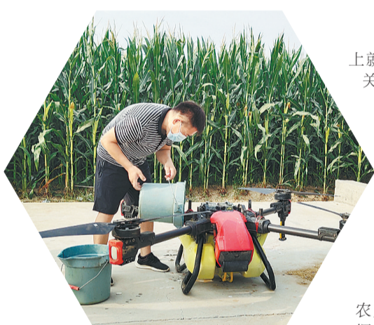
8月22日,民权县王桥镇田保姆农业服务公司的员工在给无人机添加叶面肥。据悉,该公司托管周边乡镇3万多亩农田。