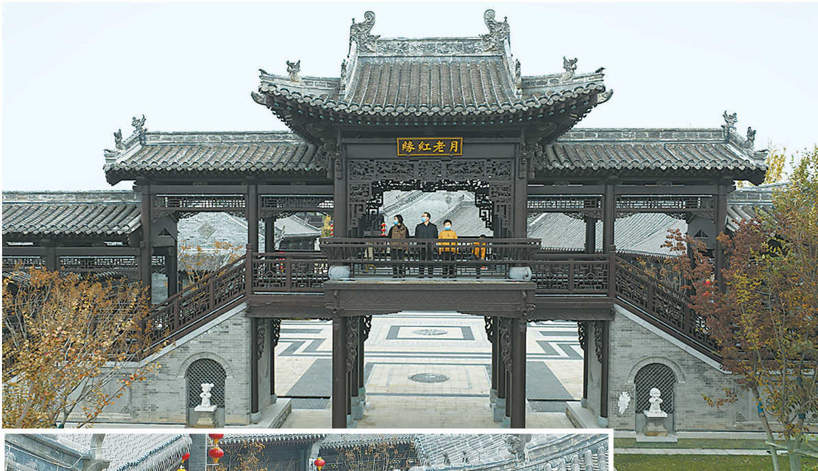
▲公园内各色建筑都以月老文化为主题。