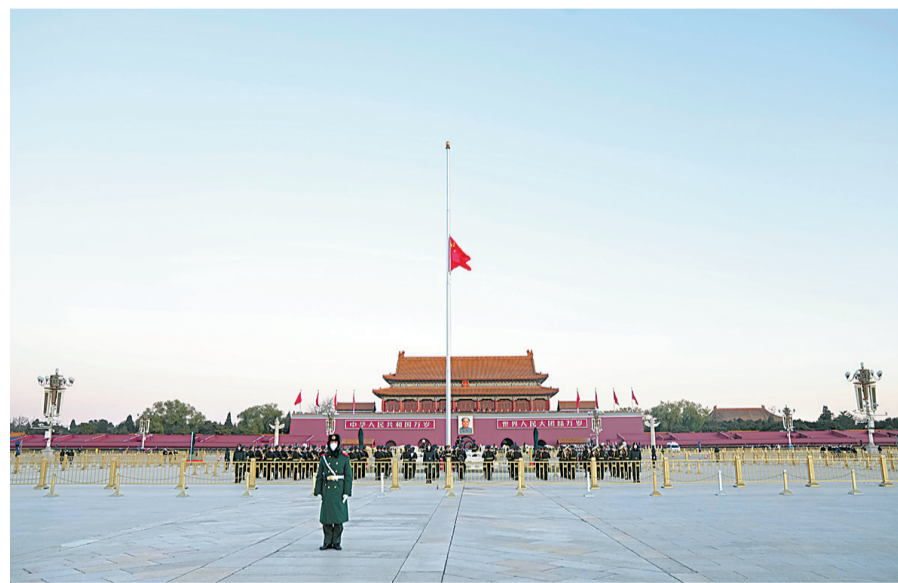
12月1日，北京天安门下半旗志哀，悼念江泽民同志逝世。

江泽民同志是我党我军我国各族人民公认的享有崇高威望的卓越领导人，伟大的马克思主义者，伟大的无产阶级革命家、政治家、军事家、外交家，久经考验的共产主义战士，中国特色社会主义伟大事业的杰出领导者，党的第三代中央领导集体的核心，“三个代表”重要思想的主要创立者。 中央和国家机关、各人民团体第一