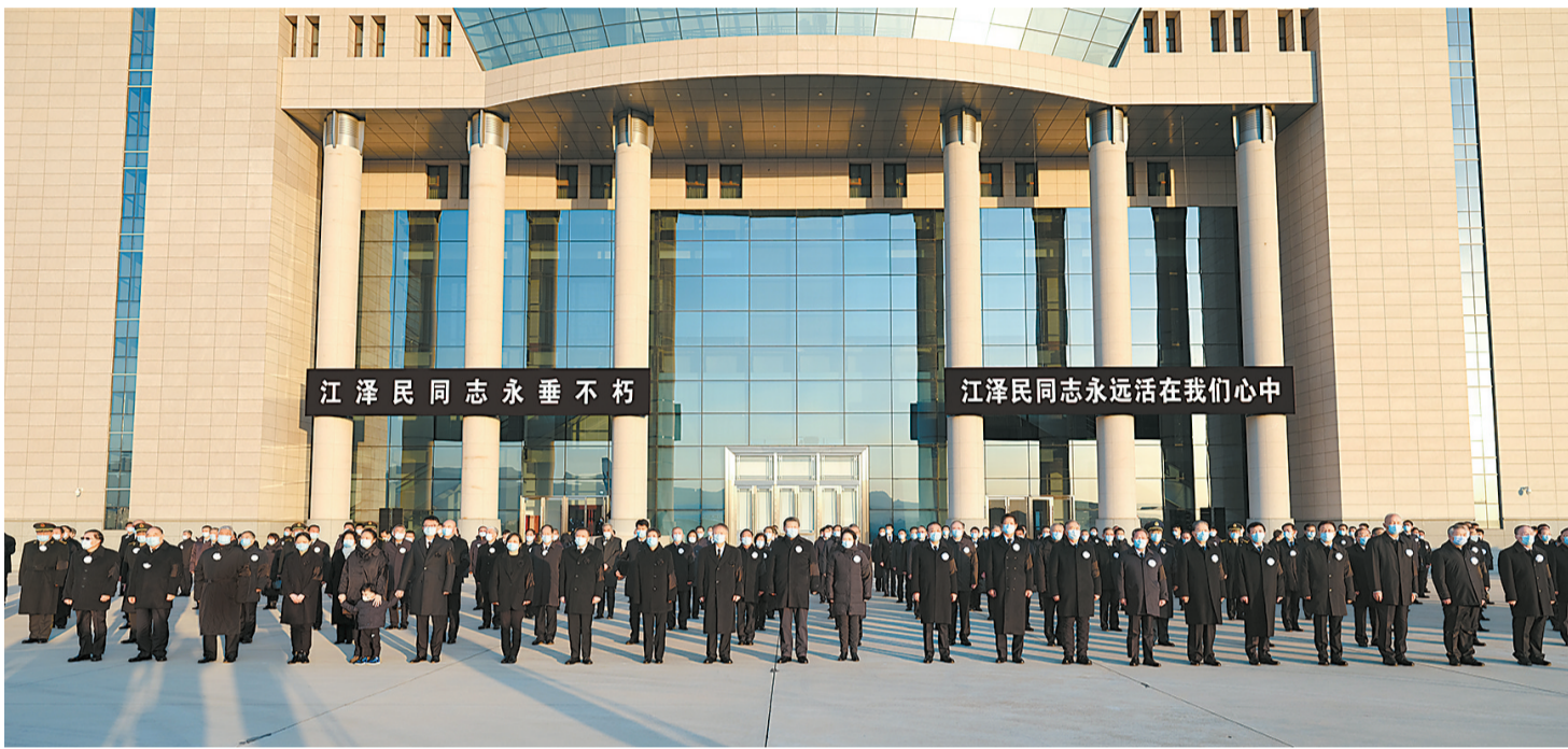
12月1日，江泽民同志的遗体从上海由专机敬移到达北京。习近平、李克强、栗战书、汪洋、李强、赵乐际、王沪宁、韩正、丁薛祥、李希、王岐山等党和国家领导同志到北京西郊机场迎灵。蔡奇等从上海护送江泽民同志遗体回到北京。新华社记者 李学仁 摄

新华社北京12月1日电 我党我军我国各族人民公认的享有崇高威望的卓越领导人，伟大的马克思主义者，伟大的无产阶级革命家、政治家、军事家、外交家，久经考验的共产主义战士，中国特色社会主义伟大事业的杰出领导者，党的第三代中央领导集体的核心，“三个代表”重要思想的主要创立者江泽民同志的遗体今天从上海由专机敬移到达