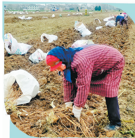
白楼乡群众在采收辣椒。

近期,该县始终坚持“四个不摘”要求,出台了《睢县脱贫攻坚过渡期脱贫户、监测户帮扶若干政策意见》,探索建立“46556”监测帮扶机制,持续发展壮大脱贫产业,鼓励引导就业,发展村集体经济;创新“6344”管理模式,确保项目资金绩效明显、监管到位、管护运行良好、效益持续发挥;强化干部培训,今年共培训干部1.3万人次,为乡村振兴提