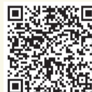
扫描二维码观看“小崔游园”视频

可以说公园很年轻。该公园自2017年开放至今，不过5年光景。也可以说公园很苍老。在绵延不断的时空中，此时的汉梁文化公园就是古时梁园的延续——这梁园雪景，是司马相如与你我共有的期待；那一轮明月，有诗仙李白与你我共同的吟赋。