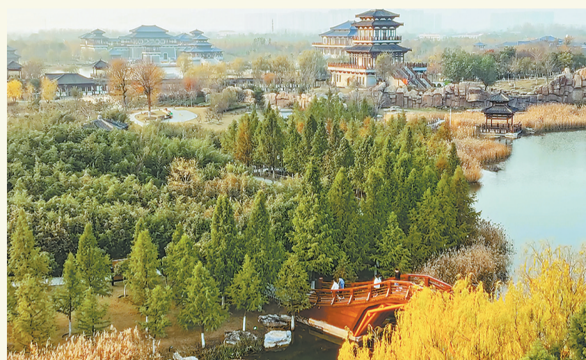
游人踏上木桥观赏景色。