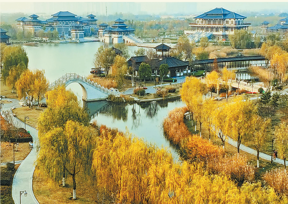
冬日的汉梁文化公园宛如一幅色彩浓郁的画卷。