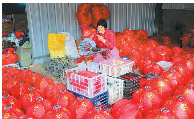
火红的日子