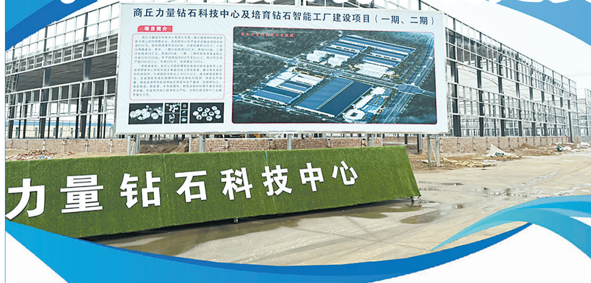
睢阳区高新区力量钻石科技研发中心(一期)建设现场。

本报讯(记者 邵群峰)“2022年，睢阳区在建3亿元以上项目14个，包括总投资200亿元的中建材凯盛科技项目、总投资150亿元的力量钻石研发中心及制造项目等。在2022年举行的4期全省“三个一批”签约仪式上，全区签约项目共17个，总投资218.7亿元，已开工项目16个，实现签约项目质效双升。”1月2日，睢阳区商务局局长王萍告诉记者。