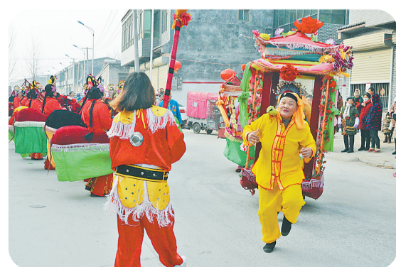
当店王村群众自发组织文艺汇演活动。

2022年4月以来，当店王村大力实施乡村振兴，全面提升人居环境，精心打造幸福家园，清除了陈年垃圾，治理了脏乱坑塘，栽植了花草树木，小村庄旧貌换新颜。同时，他们大力开展精神文明建设，在全村举办“重家教、正家风、扬家训”活动，开展“好媳妇”