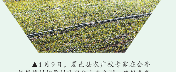
▲1月9日,夏邑县农广校专家在会亭镇楼村指导村民进行小麦冬灌,确保春季小麦根系发达,提高小麦分蘖率,实现高产稳产。本报融媒体记者 韩丰 摄