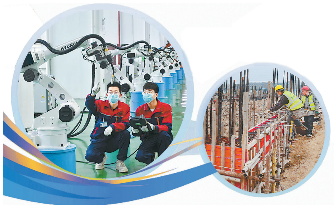
左图:1月8日,孔祖中专学生在夏邑县新能源实训基地的车间里实习。右图:1月9日,夏邑县在建项目——轻跑新能源汽车项目正在紧张施工中。该项目由浙江台州轻跑新能源汽车有限公司投资兴建,年产5万台小型电动汽车,年产值20亿元,年纳税1亿元。

夏邑县围绕提质发展传统产业、培育壮大新兴产业、前瞻布局未来产业,谋划“五系一本一整治”产业发展模式,着力打造航天锂电、轴部、印染3个千亿级