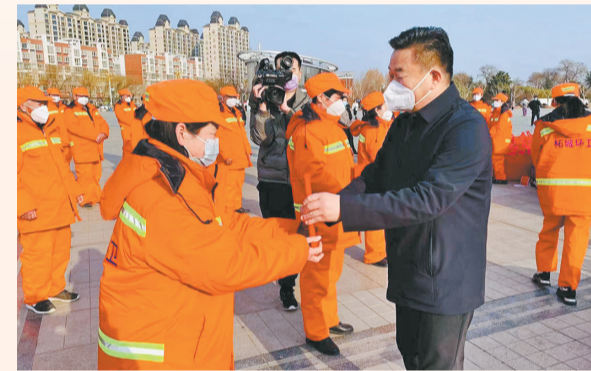
1月10日,柘城县在千树园公园举办冬季送温暖暨2022年度优秀环卫工人表彰仪式,共为全县环卫工人发放棉鞋1200双、棉服1200套、春秋装1200套和米面油等慰问品。