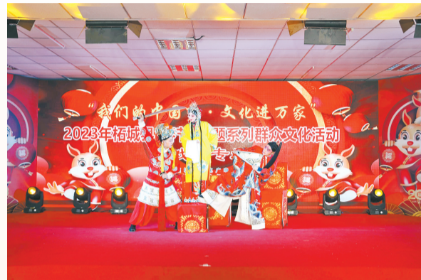
1月5日—6日,“我们的中国梦·文化进万家”——2023年柘城县“春节”主题系列群众文化活动在县文化艺术中心完成录制。活动将在春节期间通过省“百姓文化云”和“柘城文旅云”平台全程线上展播。

一系列关怀慰问活动的进行,传递了党和政府对困难群众的关爱,提升了群众的获得感、幸福感、安全感。