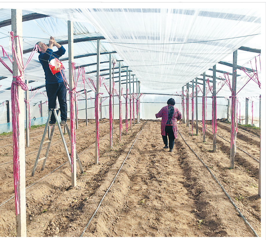
1月14日,宁陵县孔集乡王福来村村民在为大棚安装双层保温膜。据悉,该镇把大棚经济作为发展现代农业,促进农民增收、农业增效的重要增长点来抓,强化政策措施,加大扶持力度,推动大棚经济不断发展壮大。

只有扎实推进基层党组织建设工作,才能更好履行应急管理职责使命。市应急管理局始终坚持“基础工作当典型,创新工作做试点”的工作方针,时刻关注全国先进地区工作创新和经验做法,采用走出去学、请进来教等方法,认真谋划安排和推动工作落实。推动将基层应急体系和能力建设纳入市政府2021年十件民生实事之一,高质量完成建设任务。充分发挥本市资源优势和省应急管理厅统筹协调、顶层设计、政策人才支持等优势,开展厅地战略合作,进一步提升应急救援能力。争取省级区域性综合应急救援