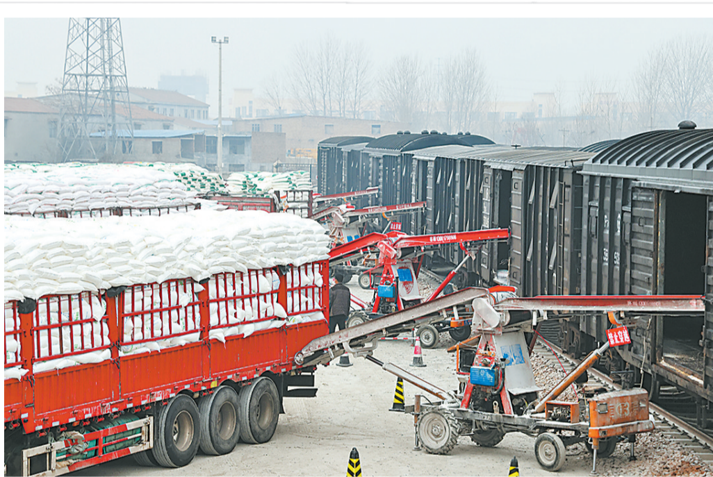
近日,商丘铁路货场内装卸工人正在将面粉装车,发往全国各地。据悉,在民生物资运输上,该铁路货场在装卸劳力、人员组织、货位配置等方面予以重点倾斜,积极搭建“绿色通道”,确保物资及时送到人民群众手中。