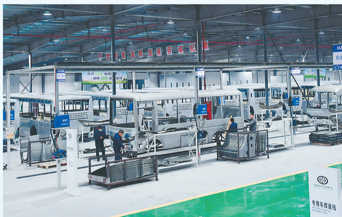
夏邑县高新区华茂汽车有限公司新能源特种车辆项目。