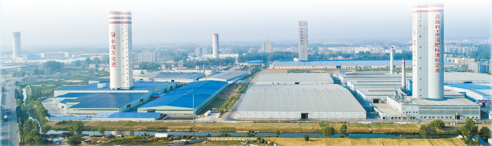
宁陵县先进制造业开发区内高塔林立、企业集聚。