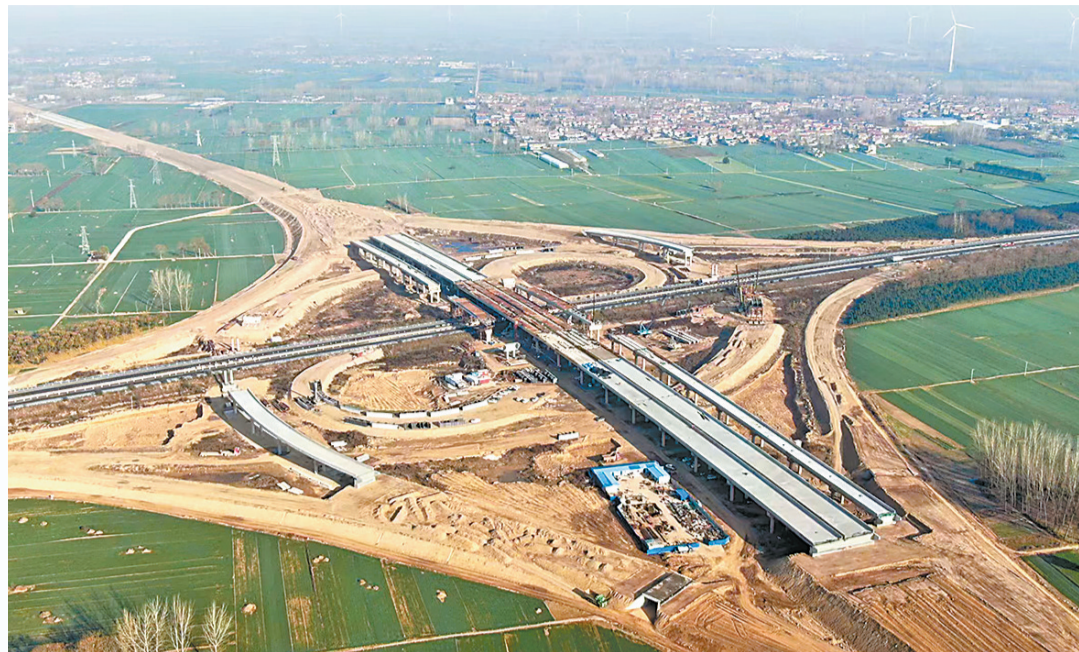
◀ 阳新高速柘城段施工现场。