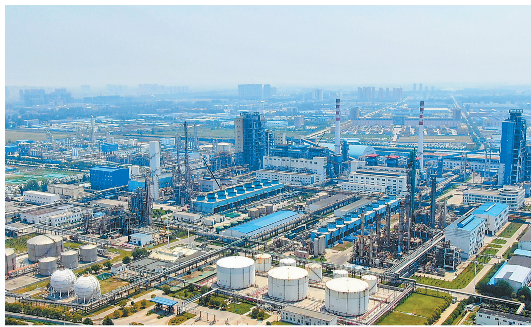
◀ 永城市煤化工产业园气势恢宏。