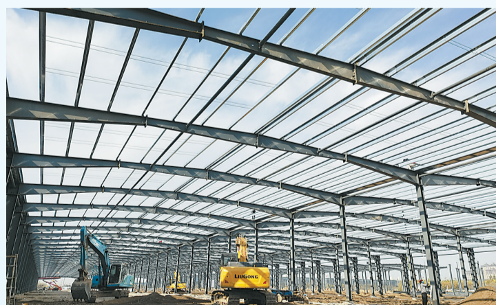
虞城县零碳产业园项目。本报融媒体记者 刘建说 摄