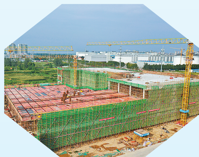
梁园区投资100亿元的数智集美产业园一期封顶。