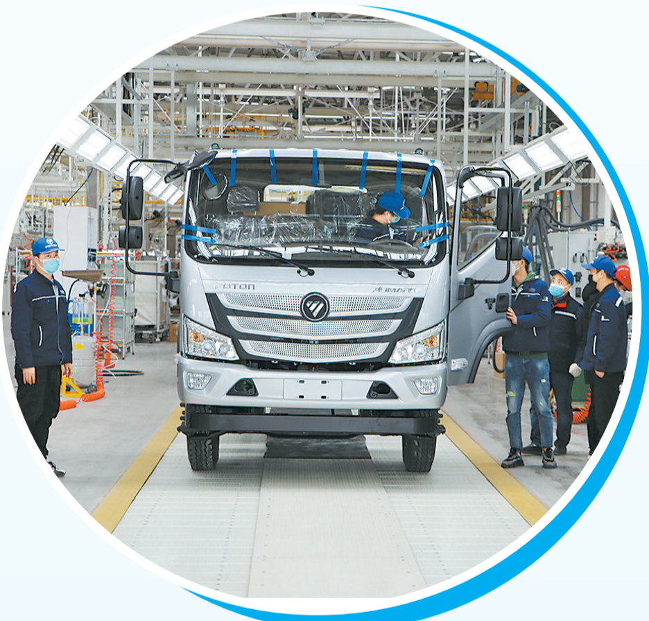
位于示范区的河南福田智蓝新能源汽车有限公司生产车间。