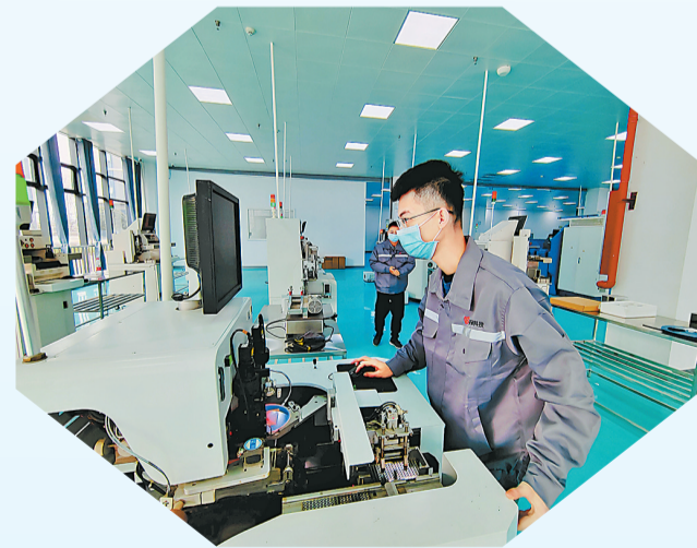
睢县璞美智能科技有限公司员工在流水线上作业。