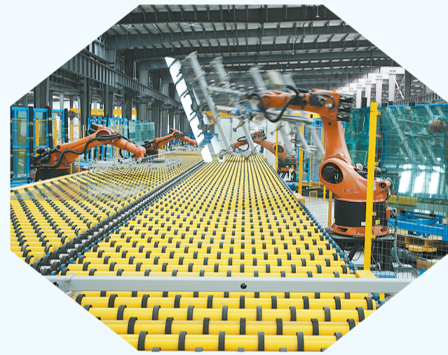
位于睢阳区的河南省中联玻璃有限责任公司深加工(二期)项目。