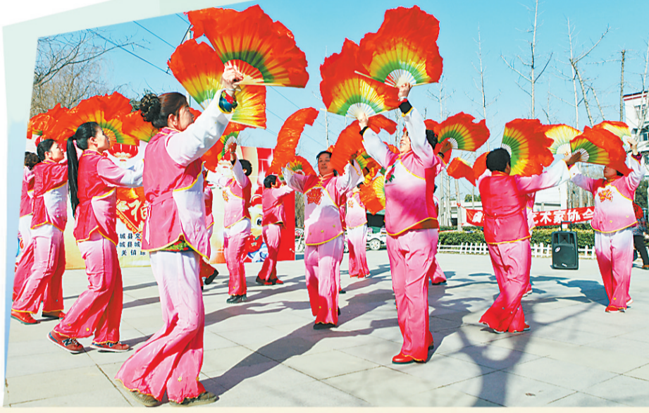
2月27日，虞城木兰女子表演队在两河口公园排练扇子舞。

虞城县爱心志愿服务联盟，他们先后开展疫情防控志愿服务、孤儿助学工程、“一对一”走访帮扶等活动，参与了黄河湿地穿越、河南省自行车冠军赛、爱心晚餐等志愿服务，在社会各界引起强烈反响。