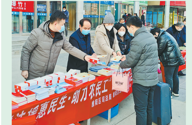
近日,睢阳区司法局组织法律援助中心、公证处、依法治区办公室在商丘火车站开展“法援惠民生、助力农民工”法治宣传活动。

参考人员纷纷表示,在复习准备理论测试的过程中,不仅大大增强了自己对依法治国理念、依法行政和服务型行政执法的深刻理解和自身法治素养,更提升了把法治思维、法治方式运用到工作实践中去的能力。在今后工作中,要立足自身岗位,持续推进依法行政,加强对行政指导、行政调解等服务型行政执法方式的探索和运用,继续优化法治化营商环境,真正提高群众的法治获得感、幸福感。本次测试对全面深入推进法治商丘建设、创建法治政府建设示范市起到了积极示范带动作用。