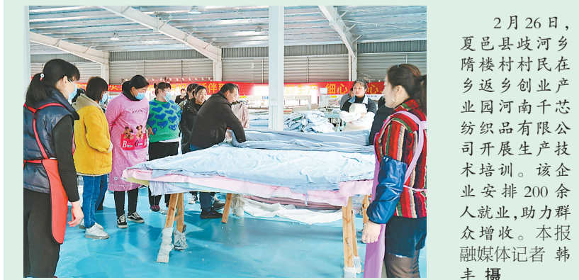
2月26日,夏邑县歧河乡隋楼村村民在返乡创业产业园河南千芯纺织有限公司开展生产技术培训。该企业安排20余企业就业,助力群众增收。