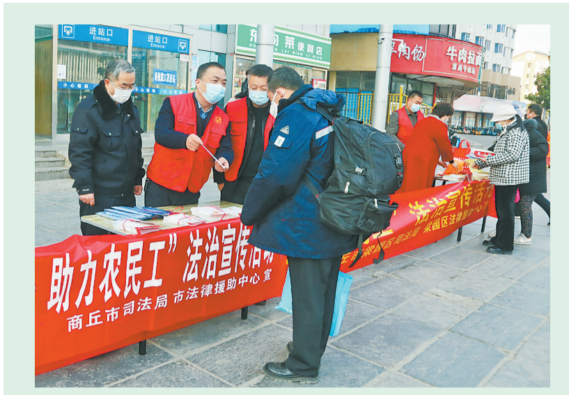
近日,市司法局组织梁园区司法局、睢阳区司法局及法律援助机构在商丘市中心汽车站联合开展了“春暖农民工”暨“法援惠民生、助力农民工”法治宣传活动。

料和法治文化宣传品。据统计,此次活动向农民工发放宣传手册、普法传单等宣传用品600余份,法治文化宣传品300余个,现场解答农民工咨询30余人次,切实解决了农民工急难愁盼问题。通过开展法治宣传活动,引导群众尊法、学法、守法、用法,指导农民工运用法律武器维护自己的合法权益,从源头促进合法用工、安心就业,为我市高质量发展提供法律保障,得到了广大农民工的好评。市司法局有关负责人表示:“全市司法行政机构和法律援助机构将继续推进‘法援惠民生’系列活动深入开展,不断扩大法律援助知晓率和影响力,更好满足群众日益增长的公共法律服务需求,为法治商丘建设营造良好的社会氛围。”