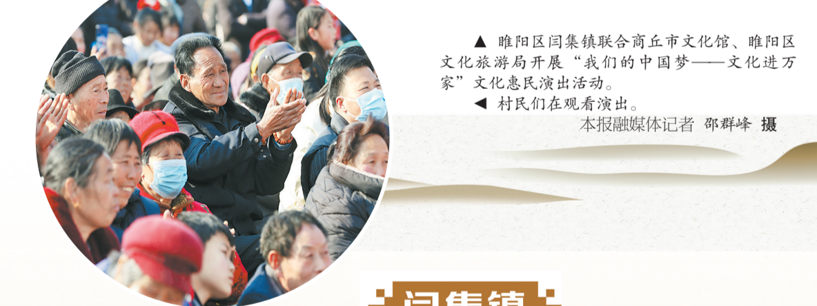
▲睢阳区闫集镇联合商丘市文化馆、睢阳区文化旅游局开展“我们的中国梦——文化进万家”文化惠民演出活动。