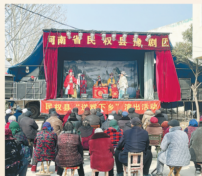
村民们在看戏曲演出。

“此次戏曲下乡活动的举办为村民们送来了欢乐与笑声,带来了政府的温暖与关爱,更是将好政策、好传统送到了群众身边,助推了乡风文明的建设,下一步,我乡将以文化所、站为阵地,开展多种形式文化进万家活动,真正做到将文化惠民工程贴近群众、深入农村,引导村民形成积极向上的乡村文明新风尚,营造良好乡村文化氛围。”伯党乡党委书记陈大春如是说。