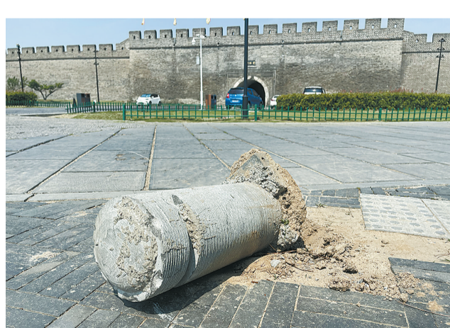
近日,在商丘古城景区东城门外,道路旁一处大理石路障损毁倾倒。