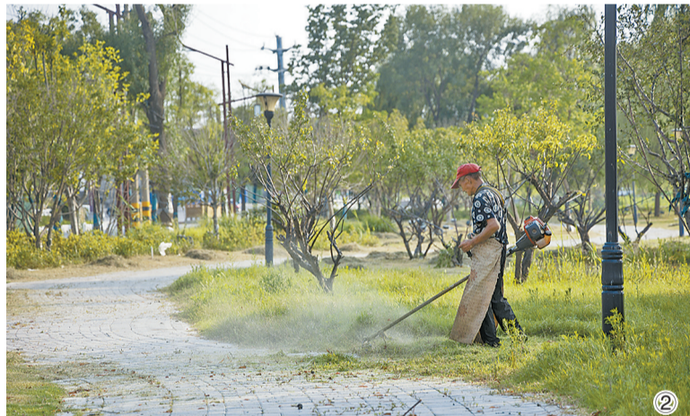
图2:7月23日,园林工人在商丘古城景区内修剪草坪,保持良好的景区绿化效果,为市民游客休闲娱乐创造良好环境。