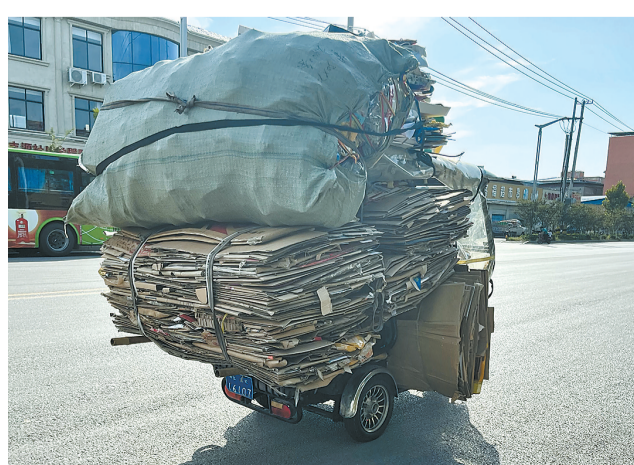
7月23日,一辆超载的电动三轮车行驶在珠江路机动车道上,存在交通安全隐患。