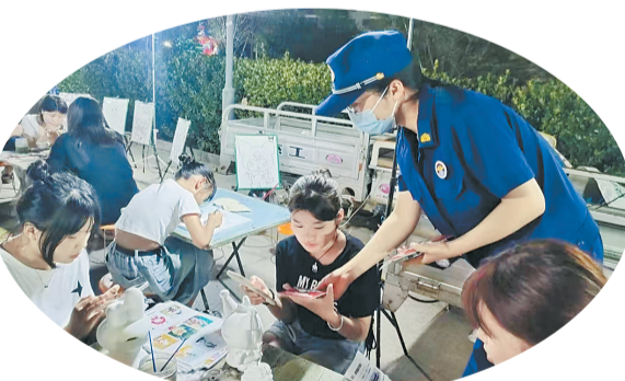
消防人员向市民宣传消防安全知识。