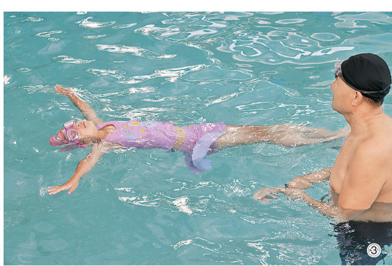
图3:7月23日,在市区一游泳馆内,小朋友在教练指导下学习游泳。暑假期间,我市众多中小学生在游泳馆,学习游泳,乐享清凉。