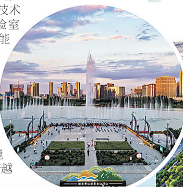
兰州新区栖霞湖畔。