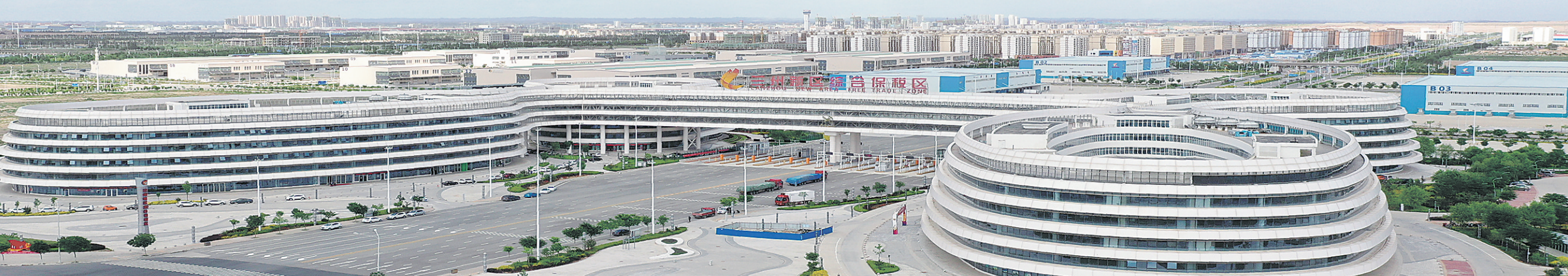
兰州新区综合保税区。