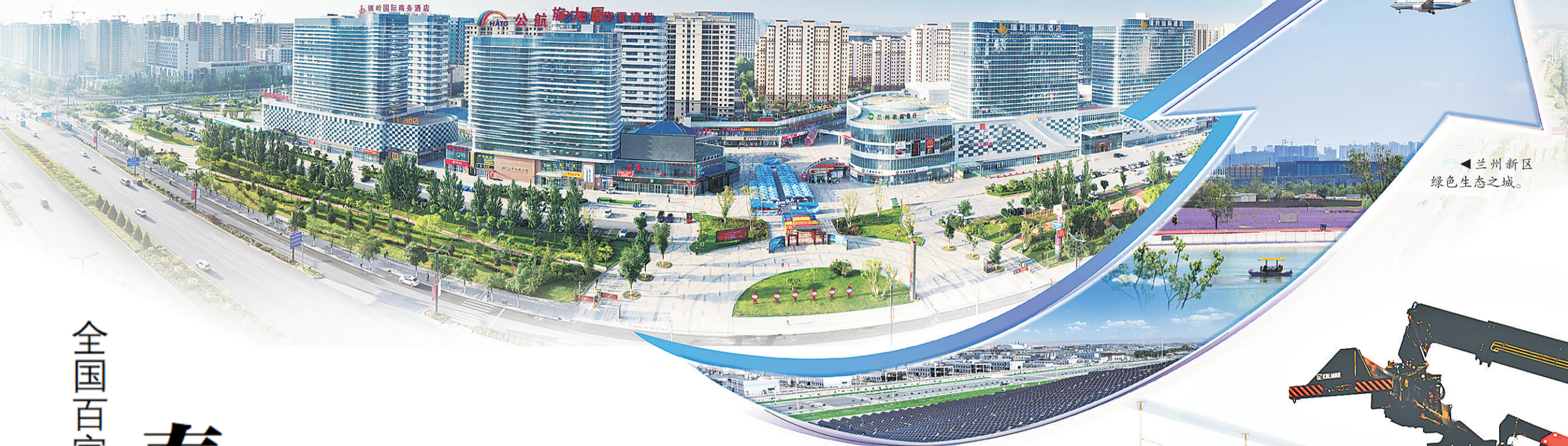
兰州新区绿色生态之城。

未来可期的兰州新区正成为西北地区经济发展最活跃、营商环境最优、改革创新最具活力、生态环境最具吸引力的国家级平台，正等待着越来越多的有志之士共同参与！