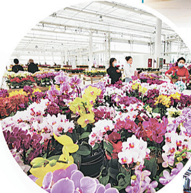
兰州新区花卉智能温室春意盎然。