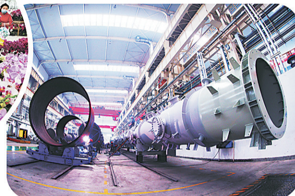
兰州新区对外开发+新通道。