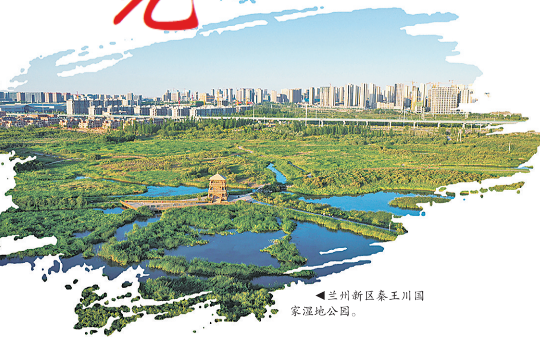
兰州新区秦王川国家湿地公园。