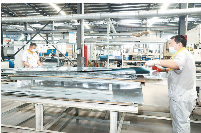
8月9日,位于民权县双塔镇工业园区的中沃木业有限公司员工在赶制订单。据悉,近年来,该公司加快企业转型升级步伐,由原来依赖房地产市场转型为服务于地铁、储能等高端防火门的应用,目前该公司产销两旺。