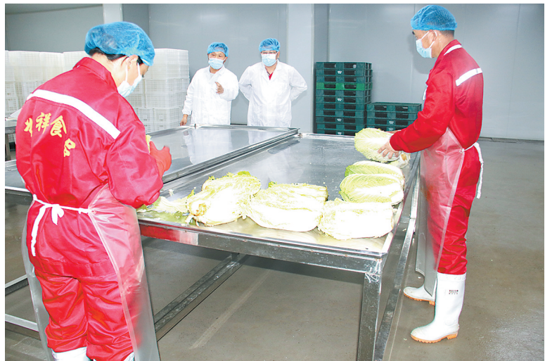
8月8日,位于民权县老颜集乡的商丘源民绿色食品有限公司员工在分拣白菜。据悉,该乡依托本地资源和劳动力优势积极探索蔬菜加工业,拉长产业链,提升价值链,推动农产品出口创汇,助力乡村振兴。

“阵地建好了,用好是关键。接下来,我们将廉洁文化宣传教育与党性教育、廉洁教育、家风教育等活动相结合,让主题公园成为党员干部增强廉洁意识的重要阵地,实现廉洁文化的有形覆盖和有效覆盖,让崇廉尚廉在全社会蔚然成风。”该镇党委书记杨德志表示。