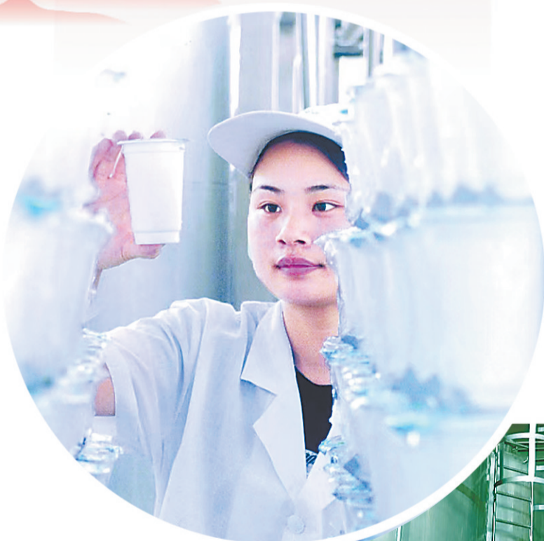
▲严把质量检测关口。 ▶生产车间一角。

“一杯牛奶 强壮一个民族”，商丘奶企护佑商丘学子。科迪集团举全集团之力，让越来越多的孩子喝上优质牛奶。当一盒盒标有“中国学生饮用奶”字样的科迪学生奶被送到全市中小學生手中時，可以看到商丘本土奶企的責任與擔當。未來，科迪集團定會在市委、市政府堅強領導下，為建設教育強市的征程中貢獻本土乳企力量！