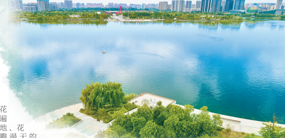
日月湖一角