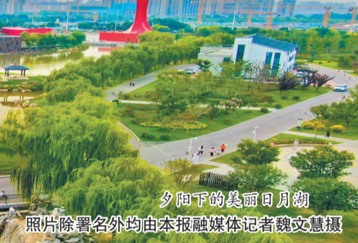
夕阳下的美丽日月湖