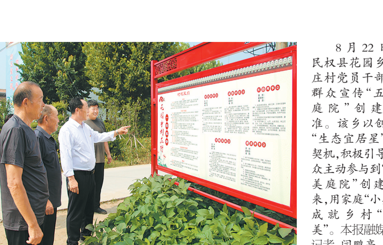
8月22日，民权县花园乡刘庄村党员干部向群众宣传“五美庭院”创建标准。该乡以创建“生态宜居星”为契机，积极引导群众主动参与到“五美庭院”创建中来，用家庭“小美”成就乡村“大美”。

行了宣讲。同时，结合当前创建全国文明城市、卫生城市等工作要求，对参训人员进行了“门前五包”的宣传与普及，阻止店外经营、违规设置广告牌等占道经营行为，增强其主人翁意识，树立“城市是我家，维护靠大家”的思想认识。此外，该局还将采取重点巡查和突击抽查相结合的方式对早餐店进行全面检查，强化食品安全监管，督促食品经营者切实履行好食品安全主体责任，从源头筑牢食品安全防火墙。