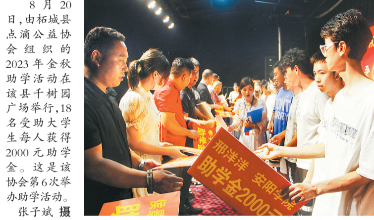
8月20日，由柘城县点滴公益协会组织的2023年金秋助学活动在柘城县千树园广场举行，18名受助大学生每人获得2000元助学金。这是该协会第6次举办助学活动。

赵萍表示，近期他们还会到其他受助学生家中进行走访慰问，在暑期完成对所有受助学子的走访及信息核实工作。下一步，将根据走访情况进行信息整理，适当调整受助人员。“希望能有更多的爱心团体及个人加入‘爱心200助学计划’中来，帮助更多学生圆求学梦。”赵萍说。