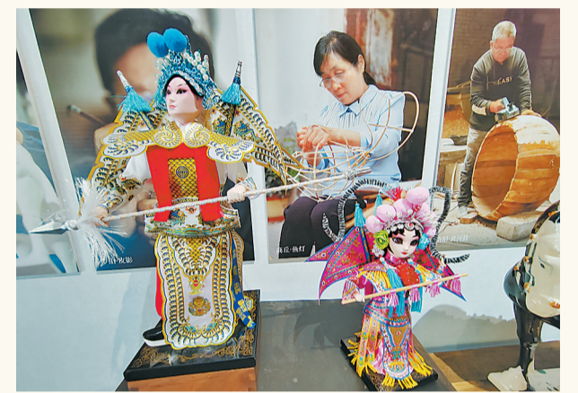
河南非物质文化遗产展示