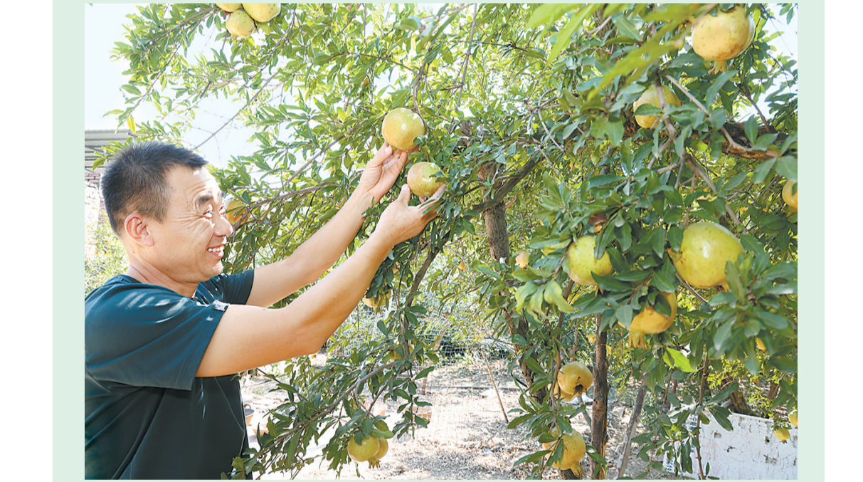
8月29日,睢阳区临河店镇贾楼村,村民查看庭院内种植的石榴成熟度。据悉,该村种植石榴历史悠久,村民们利用房前屋后闲散土地栽种果树,美化了乡村,增加了收入。