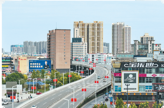
高架飞跃，道南道北均衡发展