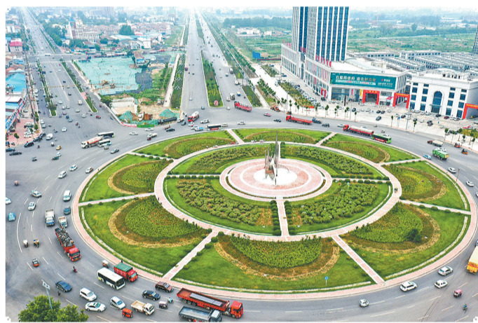
黄河路从这里出发贯穿梁园城区