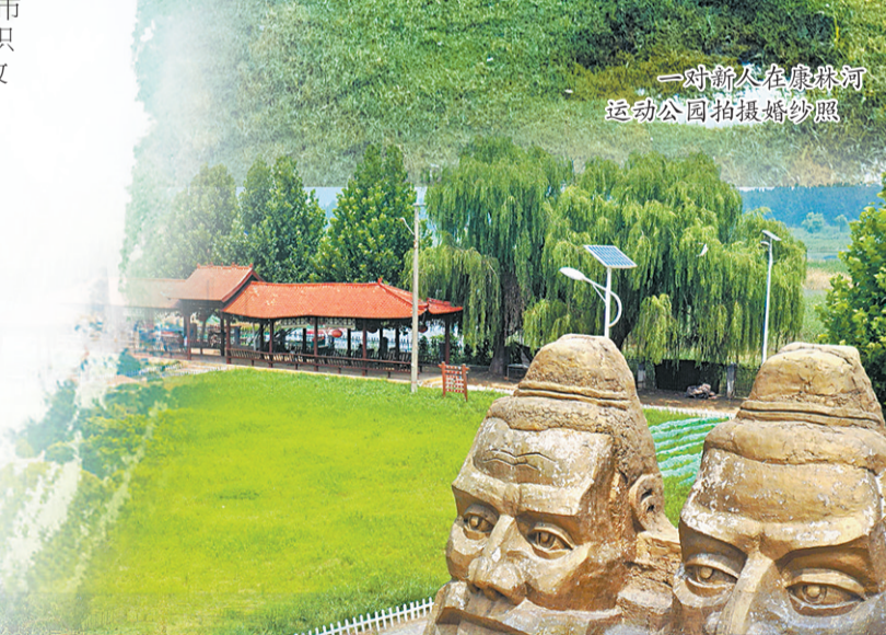
黄河故道民俗湖景区