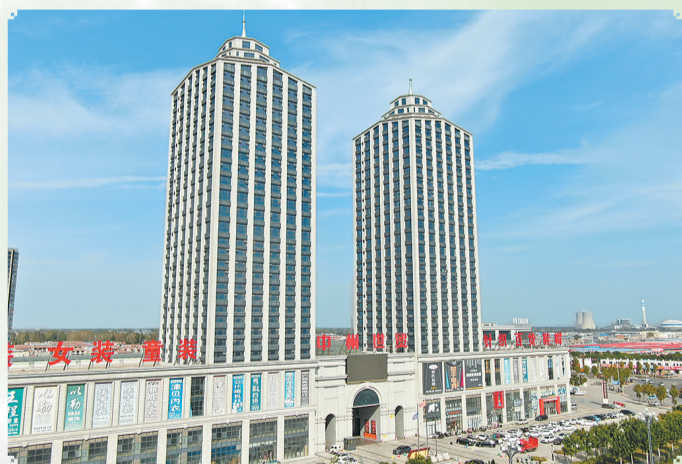
雄伟的中州世贸双子座大楼