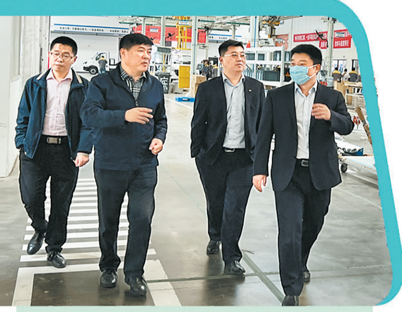
▲浦发银行商丘分行公司联动风险部进企业实地调研。

一直以来,浦发银行商丘分行坚持党建引领业务发展,以服务地方经济发展为己任,以“打造中原地区具有影响力的商业银行”为战略目标,精准“把脉”助企纾困,履行金融担当,展现金融作为,以“金融活水”助力商丘经济高质量发展。截至2023年9月末,该行各项贷款余额60.5亿元,各项存款余额37.93亿元,位列当地股份制商业银行第2位,自成立以来累计投放各类信贷资金197亿元,累计缴纳各类税款1亿余元,累计服务对公客户1836户,个人客户20万余户,先后荣获政府颁发“金融工作先进单位”“支持地方经济发展先进单位”等称号。