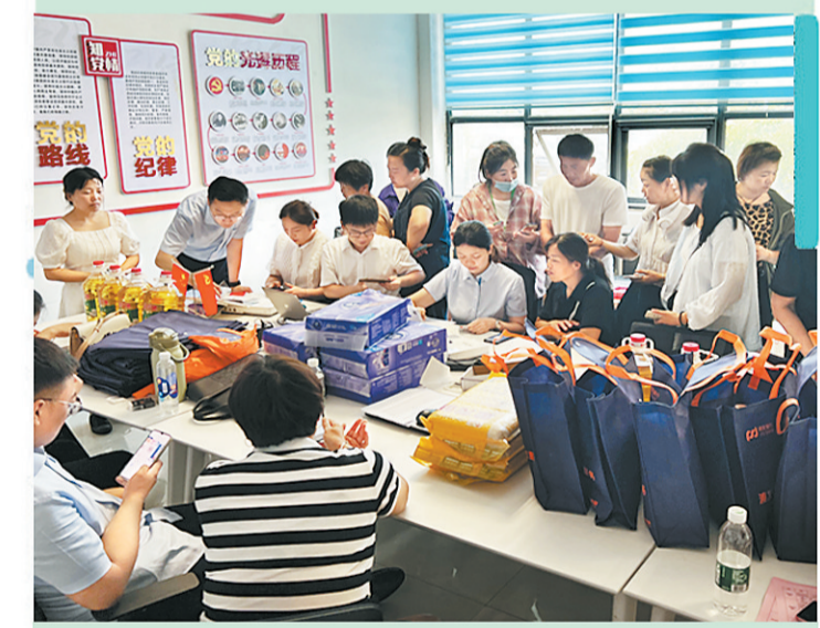
▲浦发银行商丘分行赴我市某原奶企业进行上门服务。