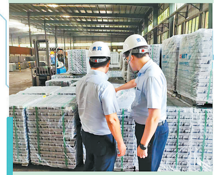
▲浦发银行商丘分行工作人员深入企业、了解资金需求。