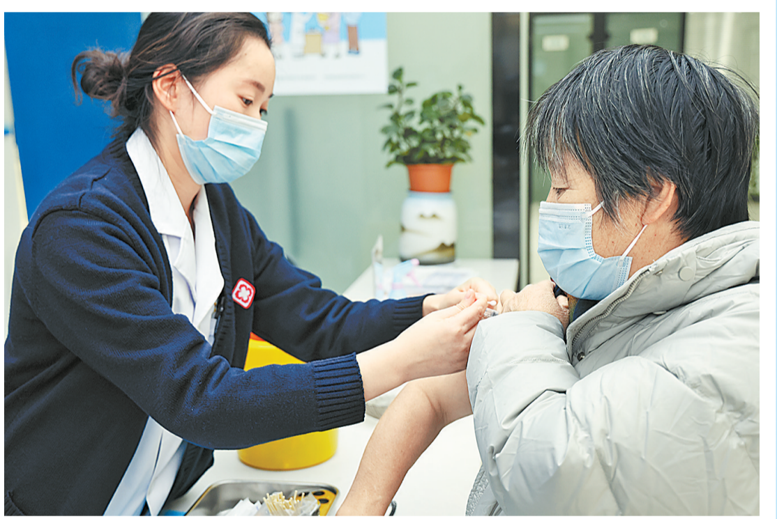
11月29日，在睢阳大道宜家门门诊部，市民正在接种流感疫苗。据悉，今冬可能出现流感病毒和新冠病毒的叠加感染，各社区卫生中心流感疫苗接种已开始“升温”。由于疫苗起效需要14天左右，专业人士提醒接种流感疫苗要趁早。

据了解，近年来，该镇诉前调解团队坚持以人民为中心，积极探索多元解纷途径，将工作着力点放在源头预防和前端化解上，推动群众来访合理诉求“一站式”多元化解，有效拓宽了依法信访渠道，提高了问题化解质量。