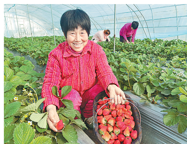
11月28日,村民在民权县林七乡付庄村果蔬大棚采摘草莓。该乡发挥大统战优势,成立种植合作社,鼓励各村进行特色种植,带动集体增收和群众在家门口就业。

李金良只是太平镇高素质农民的一个缩影。“五星”支部创建活动开展以来,太平镇以“产业兴旺星”创建为契机,不断推进农业产业结构调整,开展了“人人持证、技能河南”建设,培育了一批新型职业农民。该镇本着结构调优、规模调大的原则,积极引导农民发展特色种植及加工产业,进一步提高农产品附加值,促进农业增效、农民增收,走出了一条乡村振兴新路子。