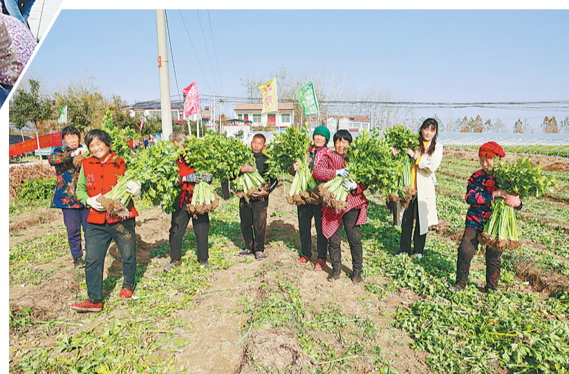
村民在柘城县胡襄镇胡芹种植基地收获胡芹。

眼下,芹菜进入了采收旺季。11月29日,在柘城县胡襄镇胡芹村的万亩大棚胡芹种植基地,村民们正抓紧采收胡芹并现场窖藏,一派喜人的丰收景象。