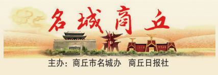
名城商丘。主办：商丘市名城办 商丘日报社

商丘古城，不是一座城，而是包括帝喾都毫、商契居商、商都南亳、宋国故城、两汉梁国都城、宋朝南应天府城6座都城，以及秦碭郡睢阳城、三国南北朝梁郡睢阳城、隋唐宋州睢阳城、金元至明初的归德府睢阳旧城、现存的明清归德府商丘县城5座郡州府城，10多座城在内的传承数千年历史的数座古都、古城的集集体。