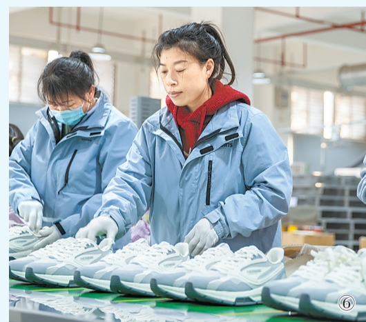
图①：1月15日，在睢县鼎能吉研科技有限公司生产车间里，工人正在焊接板材。徐泽源 摄 图②：1月12日，在位于宁陵县的河南驰野纺织有限公司生产线上，工人正在自络车间认真操作。吕然 摄 图③：1月15日，在位于睢县的商丘中轩电子科技有限公司生产车间里，工人正在赶制订单。徐泽源 摄 图④：1月12日，位于宁陵县的东隆服装企业生产车间里，一派繁忙景象。吕然 摄 图⑤：1月12日，在位于宁陵县的河南义江民族服饰有限公司生产车间里，工人正在赶制订单。吕然 摄 图⑥：1月15日，在位于睢县的中乔（河南）有限公司鞋类成品线上，工人正在进行复检工作。徐泽源 摄