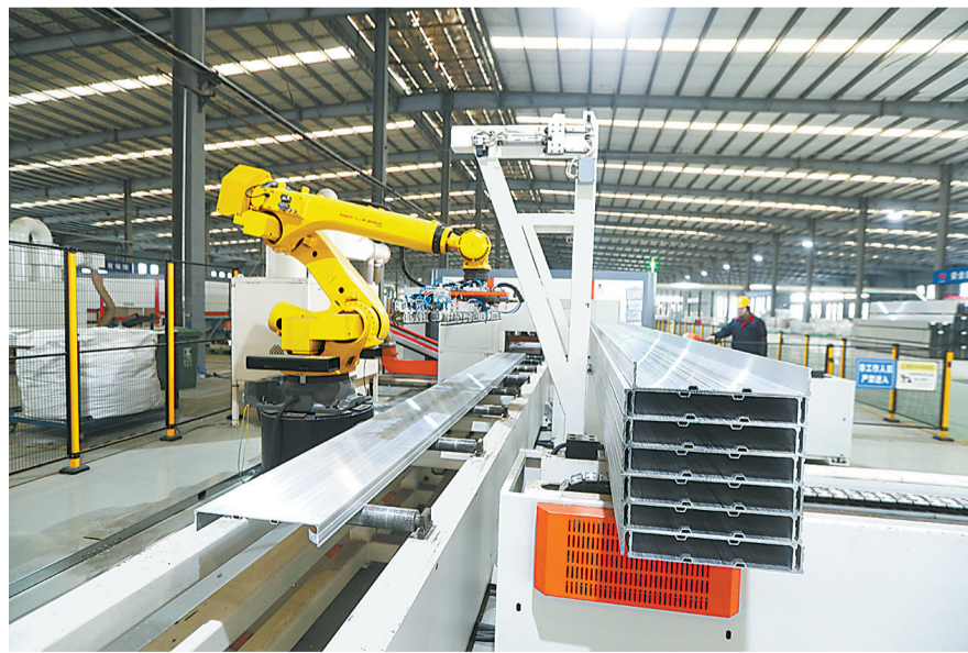
河南宏星华铝业有限公司的铝模板自动化生产车间。

该公司成立于2018年8月,是行业内首家完成集研发、熔铸、挤压、智能制造、安装、回收于一体的铝合金模板完整产业循环布局的国家高新技术企业,公司建立了从铝合金材料研发到铝模板体系的设计,再到熔铸、挤压、铝模板智能化生产等完整的铝合金模板加工产业链。公司先后被授予河南省“专精特新”企业、河南省创新型中小企业