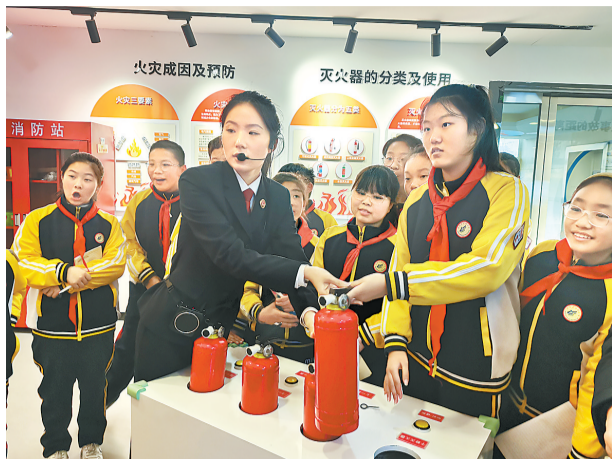
市人民检察院干警与学生进行灭火系统演练互动。

检察干警还提醒孩子们增强安全自护意识，注意防火、防电、防烟花爆竹伤害、防交通事故等安全隐患，外