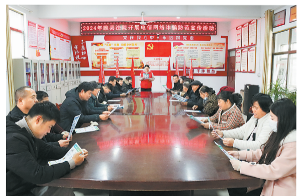
2月19日，睢县人民法院干警赴凤城街道保福村开展网络安全普及宣传教育活动，结合当下社会热度较高的电信诈骗典型案例，提醒广大村民在遨游网络世界的同时时刻保持警惕，不断提高自身的网络安全意识，维护自身在网络空间的切身合法权益。