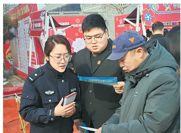
春节期间，睢阳区人民法院新城法庭干警走进商丘古城开展普法活动，为群众送上“法治大餐”和新年祝福，使群众在浓厚的节日氛围里既感受到法治的熏陶，又感受到新春佳节的快乐。