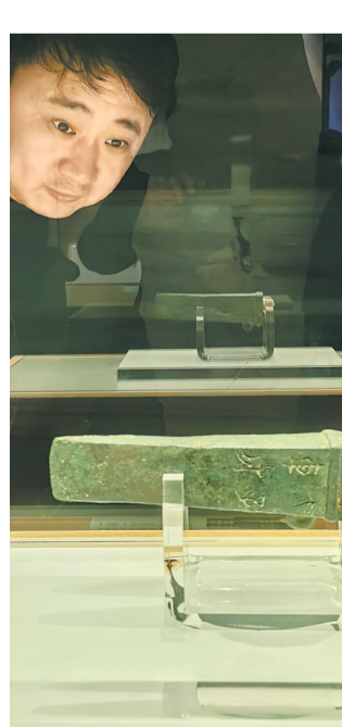
虢国博物馆里的文物。