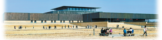
二里头夏都遗址博物馆。

二里头文化遗址确认，夏朝中晚期都邑斟鄩在这里，偃师号称“华夏第一都”。其实郑州登封的禹都阳城遗址考古发掘也发现了大型城址和城壕，且是大禹建立的夏朝最早都城“阳城”。