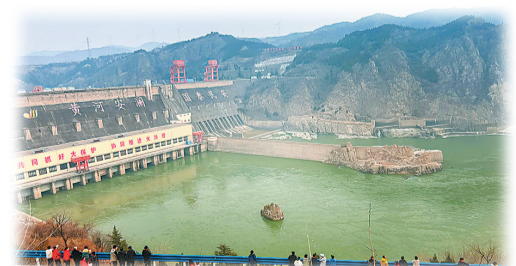
“万里黄河第一坝”的中流砥柱石。

离开渑池，到三门峡地盘，不到“万里黄河第一坝”看看似乎说不过去。徜徉在“黄河安澜，国泰民安”的三门峡大坝一侧，看到清澈舒缓、静静流淌的黄河水，心随境转起初感受到了心旷神怡的风光，继而起波澜的是看到了大坝下河水激流冲刷着的那方突出水面的石头小山峰，还有耸立河岸山上的那根上写“朝我来”的石柱。据说，二者都称“中流砥柱石”，而且有很励志很担当很有正能量的传说，当地正在建设中流砥柱命名的博物馆，堪称弘扬黄河文化之幸事。