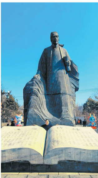
杜甫故里——巩义市瑶湾村。