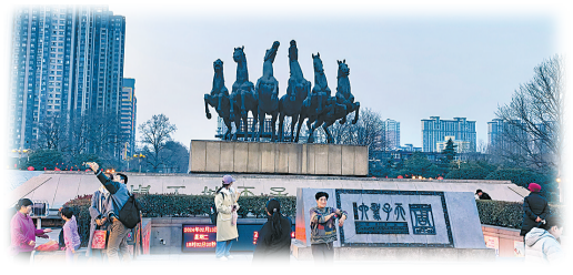
周王城天子驾六博物馆。

汉魏洛阳城起建于周朝，历经秦、汉、曹魏、西晋、北魏、北周等朝代修建使用，历经1600多年。定鼎门遗址以及在遗址之上还原而建的定鼎门，将隋唐时期洛阳城的鼎盛繁华展示得淋漓尽致。天子驾六是周朝真车真马真葬礼仪的考古出土再现，周天子的一车驾六马，连同诸侯的一车四马、大夫的一车三马、士的一车两马，