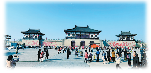
隋唐洛阳城定鼎门遗址博物馆。

三访汉魏洛阳城考古遗址博物馆，四访隋唐洛阳城定鼎门遗址博物馆，五访周王城天子驾六博物馆。这三处古城遗址、城门遗址、陪葬车马坑遗址，无声胜有声地讲述着“十三朝古都”几千年来的过往。