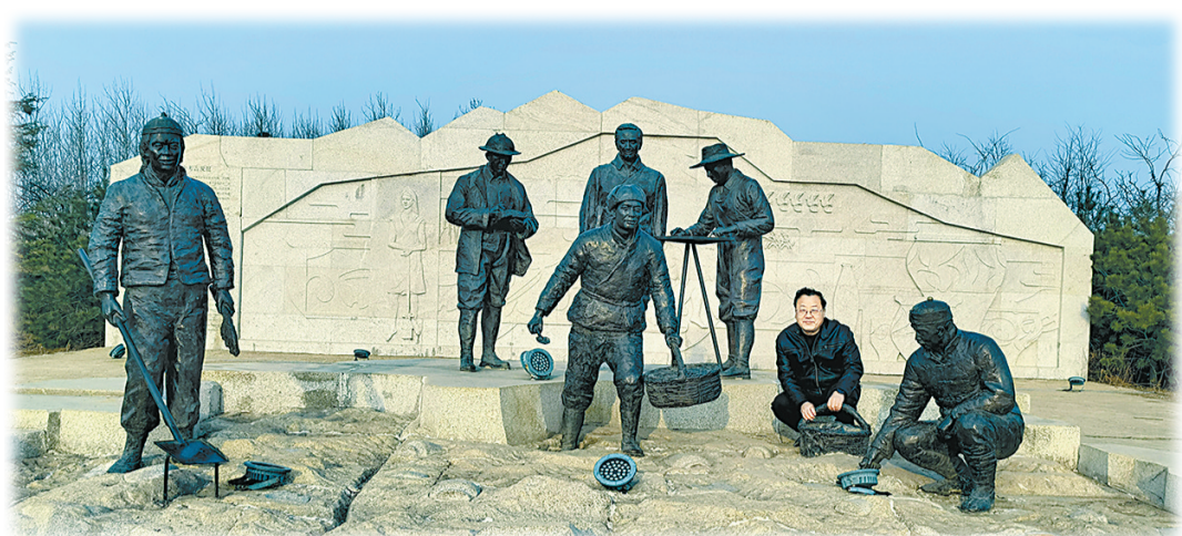
作者置身仰韶村遗址首次考古现场，与包括三位洋专家在内的考古队员群雕情景再现。