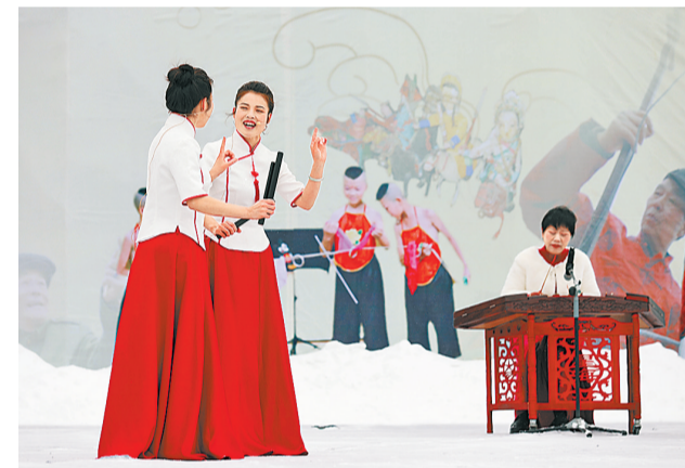
2月21日，演员在河南省平顶山市宝丰县马街书会表演河南坠子《咱们的中国节》。