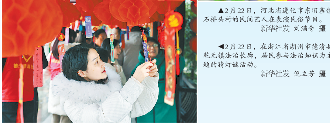
▲2月22日，河北省遵化市东田寨镇石桥头的民间艺人在表演民俗节目。