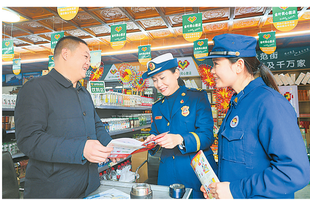
2月24日,睢阳区消防救援大队宣传人员深入沿街商铺开展消防宣传活动,通过“拉家常”的方式,提醒大家“不怕火,能防火,会自救”,确保自身和顾客人身安全。