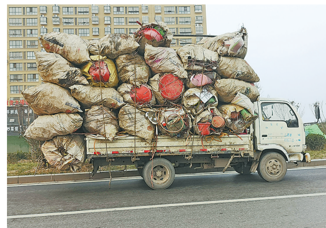
2月26日,在黄河东路,一辆超载的货车行驶在快车道上。