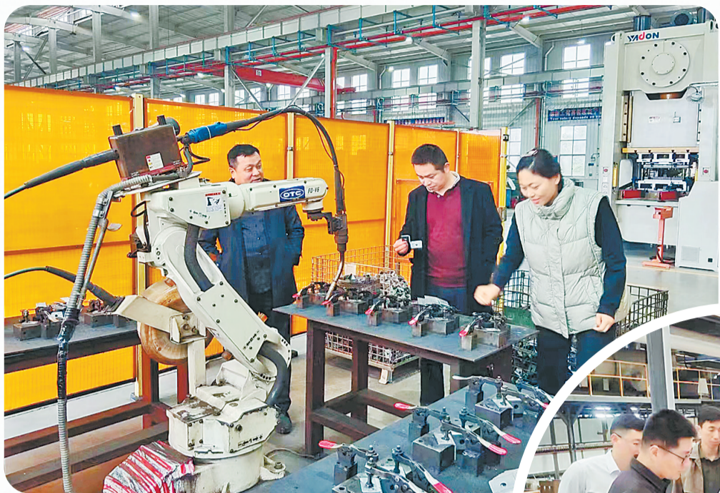
示范区工业和信息化和科技局工作人员到蓝瑞斯建筑装配科技(河南)有限公司开展万人助万企活动。