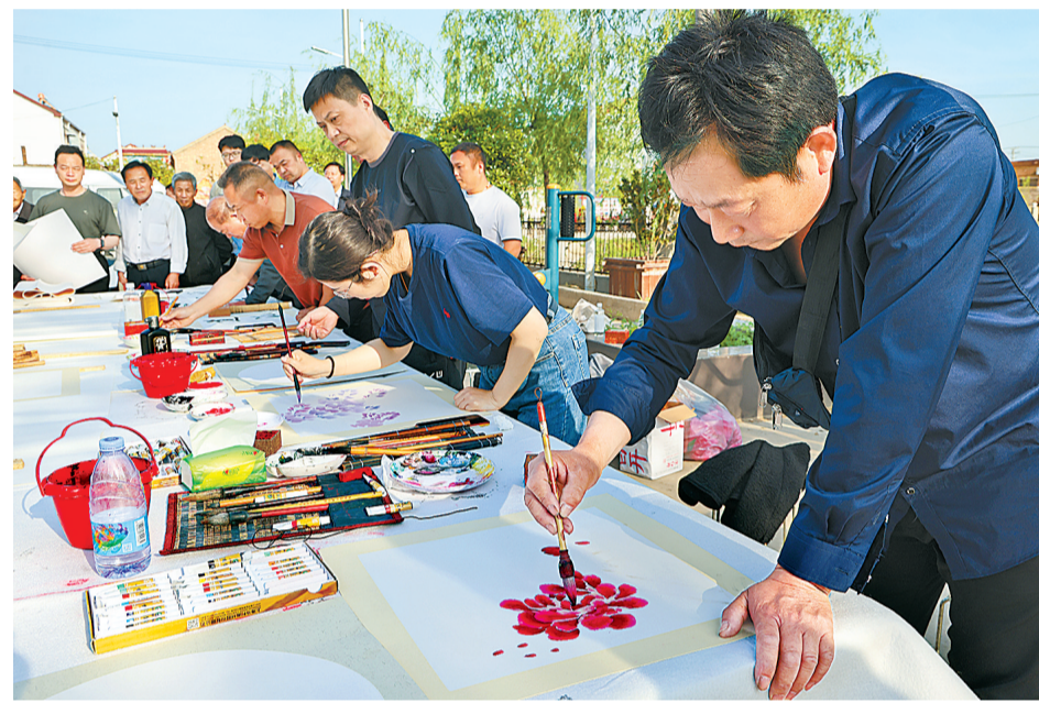
为弘扬中华优秀传统文化,丰富群众文化生活,近日,郑州铁路局集团公司书法协会的书画家到虞城县刘店乡丁河楼村开展“书画进乡村”活动。笔酣墨饱的书法、雍容华贵的牡丹图……一幅幅寓意美好、充满诗意而又励志的书画作品呈现在眼前,书画家用艺术浸润乡土大地,用文艺力量助力文明村镇建设。

严禁盲目实施救援。企业要根据本单位的有限空间作业的特点,制订有针对性的应急预案,明确救援人员及职责,落实救援设备器材,每年至少进行一次演练。发生有限空间作业险情后要按应急预案规定实施科学救援。同时,企业必须深刻汲取由于盲目救援造成事故扩大的惨痛教训,要把事故案例作为安全警示教育学习资料,宣传贯彻到每一名员工,让每一名员工都知晓盲目救援可能导致的严重后果,熟练掌握有限空间事故的应急救援知识和技能,坚决杜绝盲目施救事故的发生。