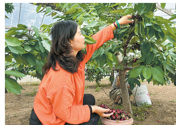
城郊乡大郭楼村村民在采摘成熟的樱桃。

本报(贾震)5月26日,在虞城县城郊乡大郭楼村樱桃种植园内,一颗颗红彤彤的樱桃挂满枝头,在初夏阳光的照射下鲜艳诱人,阵阵果香扑鼻而来,令人垂涎。村民们在硕果累累的樱桃树间来回穿梭,忙着采摘、挑选、分类、打包……一派繁忙的丰收景象。