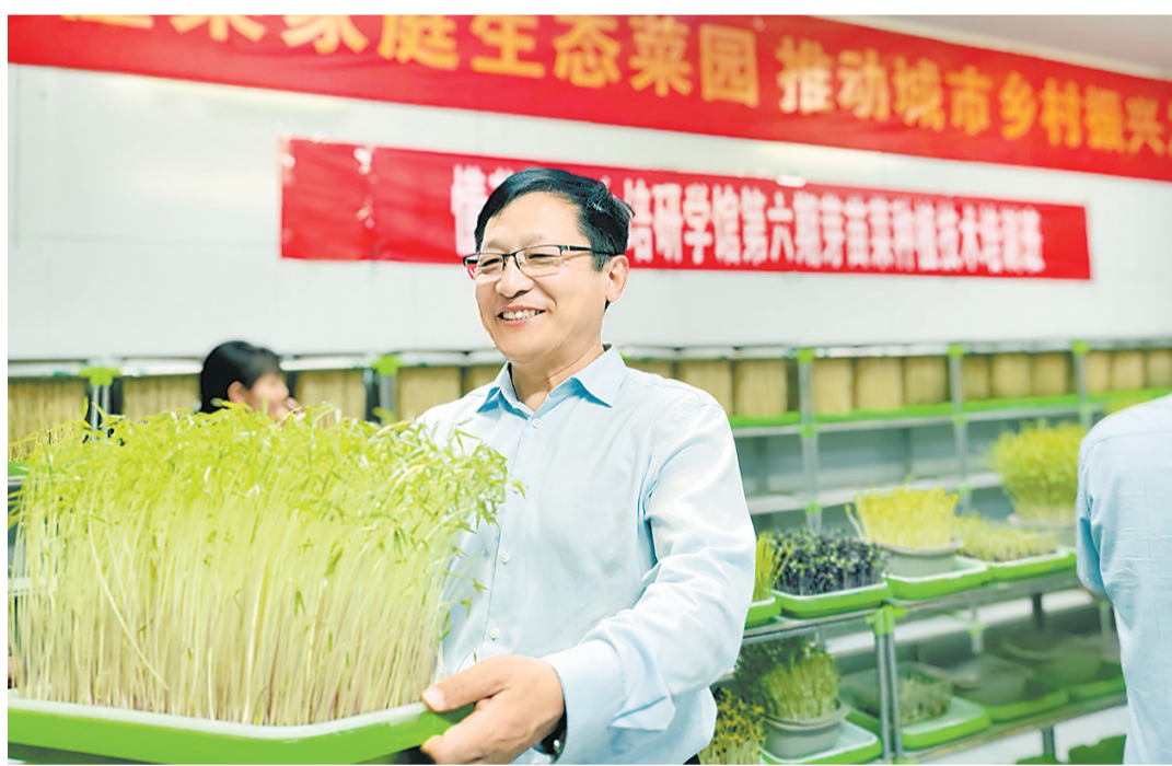
▲5月26日,在河南懂农业科技公司的无土育苗研发基地内,仅靠水和光照生长出来的芽苗菜生长茂盛。据了解,该公司的无土育苗利用立体栽培,占地面积不足半平方米就可以打造一个家庭生态小菜园。

人技结合,严格防控措施。该镇要求各村密切关注天气变化,对可能出现焚烧行为的区域进行重点监控,组织镇村干部及网格员深入田间地头,对所在网格内的秸秆禁烧情况重点巡查。同时,该镇充分发挥“蓝天卫士”监控平台作用,实行技防人防相结合,确保秸秆禁烧工作全覆盖、无死角。