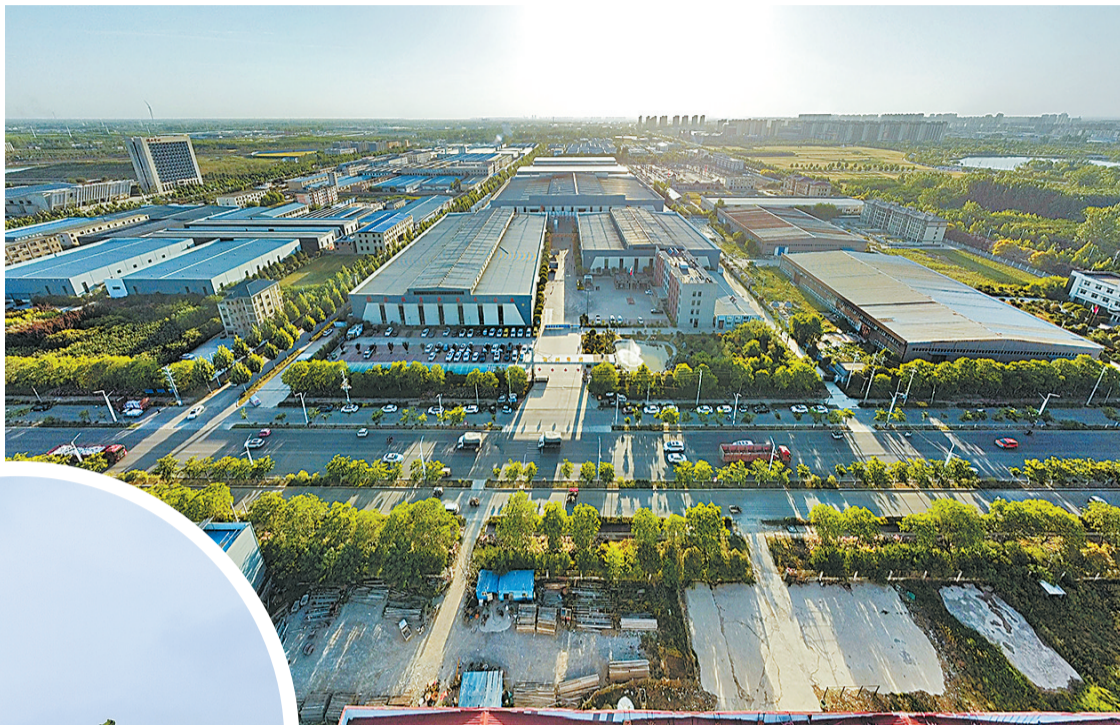
▲位于虞城县高新区的筑润集团(控股)有限公司全景。 ▲虞城县智能装备园区建设项目正在施工中。