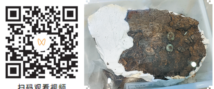
苗桥文物馆馆藏文物——王庄遗址出土的玉覆面。 苗桥文物馆馆藏文物——王庄遗址出土的石圭。

王庄遗址是研究豫东地区新石器文化和海岱文化源流的重要标本,见证了史前时代中国东西方文化的融合和南北方文化的交流。王庄遗址大汶口文化展厅通过对王庄遗址出土文物的展示,表明了王庄遗址在豫东地区史前文化中占有重要地位。