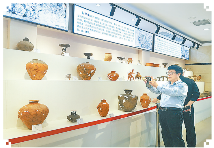
苗桥文物馆展厅展出的王庄遗址出土文物。