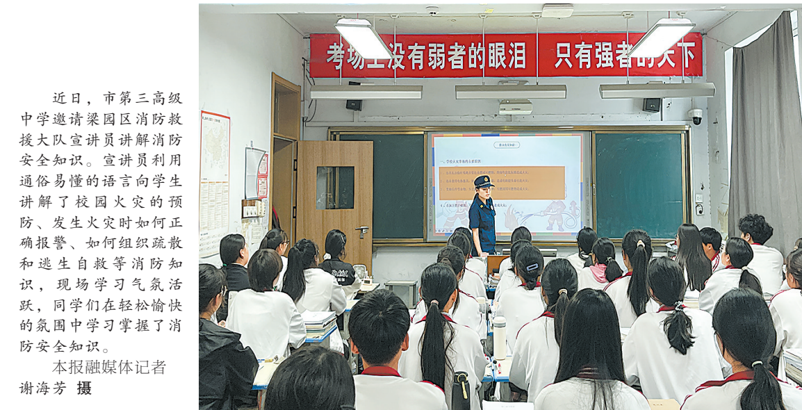
近日，市第三高级中学邀请梁园区消防救援大队宣讲员讲解消防安全知识。宣讲员利用通俗易懂的语言向学生讲解了校园火灾的预防、发生火灾时如何正确报警、如何组织疏散和逃生自救等消防知识，现场学习气氛活跃，同学们在轻松愉快的氛围中掌握了消防安全知识。