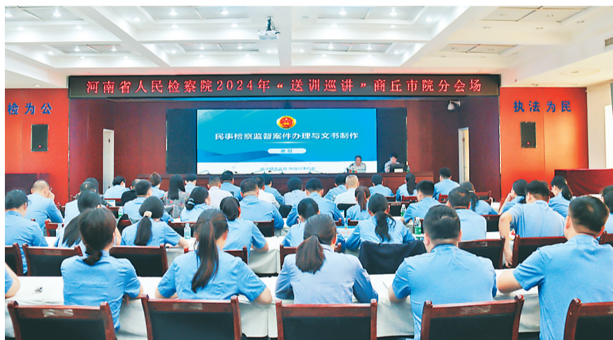
近日,省人民检察院“送训巡讲”活动在市人民检察院四个分会场同步开展,巡讲团四名专家为干警们送来了一场提升业务能力的“及时雨”。

睢县人民检察院此次行动,不仅是对校园食品安全的一次全面体检,更是检察机关参与社会治理、保护未成年人权益的一次生动实践。