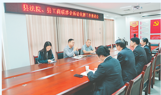
近日,民权县人民法院到该县工商联召开涉企诉讼化解工作推进会,深化协调联动机制,促进民营企业健康发展。