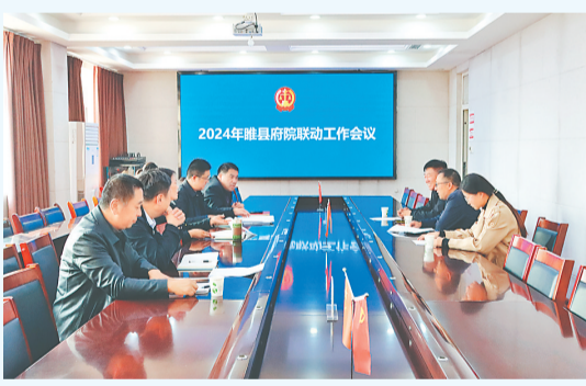
10月22日,睢县府院联动工作会议在该县人民法院召开,进一步凝聚府院合力,建立健全工作互动、信息互通、争议共调机制。